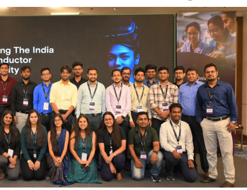
ಯುಡಬ್ಲ್ಯೂವಿ ನಿಖರವಾದ ವಿಮರ್ಶಾ ಪ್ರಕ್ರಿಯೆಯನ್ನು ಅನುಸರಿಸಿ 60 ಅಸಾಧಾರಣ ಅಭ್ಯರ್ಥಿಗಳನ್ನು ವಿದ್ಯಾರ್ಥಿವೇತನಕ್ಕೆ ಆಯ್ಕೆ ಮಾಡಿದೆ. ಈ ಹಂತದಲ್ಲಿ ಪ್ರತಿಯೊಬ್ಬರೂ ತಮ್ಮ ಅಧ್ಯಯನದ ಕ್ಷೇತ್ರದಲ್ಲಿ ಅತ್ಯುತ್ತಮ ಸಾಧನೆ ಮತ್ತು ಭರವಸೆಯನ್ನು ತೋರಿದ್ದಾರೆ. ಪ್ರತಿ ವಿದ್ಯಾರ್ಥಿಗೆ ರೂ 80,000 ಮೌಲ್ಯದ ಸ್ಕಾಲರ್‌ಶಿಪ್‌ಗಳು ಲಭಿಸುತ್ತಿದ್ದು, ಅದರಿಂದ ಅವರ ಅರ್ಥಿಕ ಹೊರ ನಿವಾರಣೆಯಾಗಲಿದೆ. ಅವರ ಹೊಸ ಚೈತನ್ಯದೊಂದಿಗೆ ಅವರ ಶೈಕ್ಷಣಿಕ ಆಕಾಂಕ್ಷೆಗಳನ್ನು ಪೂರ್ಣಗೊಳಿಸಲು ಈ ವಿದ್ಯಾರ್ಥಿವೇತನ ಅನುವು ಮಾಡಿಕೊಡುತ್ತದೆ. ಈ ಕುರಿತು ಮಾತನಾಡಿದ ಮೈಕ್ರಾನ್ ಕಾರ್ಯನಿರ್ವಾಹಕ ಉಪಾಧ್ಯಕ್ಷ ಮತ್ತು

ಒದಗಿಸಲಾಗುತ್ತದೆ. ವಿದ್ಯಾರ್ಥಿ ವೇತನ ಸ್ವೀಕರಿಸುವ 60 ವಿದ್ಯಾರ್ಥಿಗಳಲ್ಲಿ 16 ಮಹಿಳೆಯರು ಮತ್ತು 10 ಮಿಲಿಟೇಶಿಯನ್ (ಪಿಡಬ್ಲ್ಯೂಡಿ) ವರ್ಗದ ವಿದ್ಯಾರ್ಥಿಗಳು ಒಳಗೊಂಡಿದ್ದಾರೆ. ವಿದ್ಯಾರ್ಥಿವೇತನ ಯೋಜನೆಯು ಮೈಕ್ರಾನ್ ಎಲ್ಲರನ್ನೂ ಒಳಗೊಳ್ಳುವ ಮತ್ತು ಪ್ರತಿಭಾವಂತರನ್ನು ಪ್ರೋತ್ಸಾಹಿಸುವ ಬದ್ಧತೆಯನ್ನು ತೋರಿಸುತ್ತದೆ. ಐಐಟಿ ದೆಹಲಿ, ಐಐಐಟಿ ಬೆಂಗಳೂರು, ಐಐಟಿ ಗಾಂಧಿನಗರ, ಐಐಟಿ ಹೈದರಾಬಾದ್, ಬಿಜ್ಜೆ ಪಿಲಾನಿ, ನ್ಯಾಷನಲ್ ಇನ್‌ಸ್ಟಿಟ್ಯೂಟ್ ಆಫ್ ಟೆಕ್ನಾಲಜಿ ಕರ್ನಾಟಕ, ಸುರತ್ತಲ, ಇಂದಿರಾ ಗಾಂಧಿ ದೆಹಲಿ ಮಹಿಳಾ ತಾಂತ್ರಿಕ ವಿಶ್ವವಿದ್ಯಾಲಯ (ಐಡಿಡಿಐಯುಡಬ್ಲ್ಯೂ), ಎನ್‌ಐಟಿ ತಿರುಚ್ಚಿ ಮತ್ತು ಜೆಎನ್‌ಐಯು-ಎಚ್ ಕಾಲೇಜ್ ಆಫ್ ಇಂಜಿನಿಯರಿಂಗ್ ಸೇರಿದಂತೆ ಭಾರತದ ಕೆಲವು ಪ್ರಮುಖ ಸಂಸ್ಥೆಗಳ ವಿದ್ಯಾರ್ಥಿಗಳು ವಿದ್ಯಾರ್ಥಿ ವೇತನ ಪಡೆಯಲಿದ್ದಾರೆ. ಆಯ್ಕೆ ಪ್ರಕ್ರಿಯೆಯ ಕುರಿತು ರಾಷ್ಟ್ರ ವ್ಯಾಪಿ ಕಾಲೇಜು ಮತ್ತು ಪ್ರಚಾರಗಳನ್ನು ಕ್ಯಾಂಪಸ್ ಮತ್ತು ಮಟ್ಟದಲ್ಲಿ ವಿದ್ಯಾರ್ಥಿಗಳನ್ನು ತಲುಪಲಾಗಿತ್ತು. ಆದ್ದರಿಂದ ರಾಷ್ಟ್ರದಾದ್ಯಂತ 494 ಸಂಸ್ಥೆಗಳಿಂದ 2,677 ಅರ್ಜಿಗಳು ಬಂದಿದ್ದವು. ತಾಂತ್ರಿಕ ಮೌಲ್ಯಮಾಪನದ ಜೊತೆಗೆ ಪ್ರವರ್ಧನಾತ್ಮಕ ಅಯ್ಕೆಯ ಮಾನದಂಡಗಳ ಆಧಾರದ ಮೇಲೆ