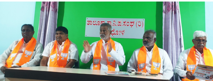
ಓತದೃಷ್ಟಿಯಿಂದ ಎಲ್ಲರೂ ಬಿಜೆಪಿಗೆ ಮತ ನೀಡಬೇಕು. ಗ್ಯಾರಂಟಿಗಳಿಂದ ದೇಶದ ಅಭಿವೃದ್ಧಿ ಸಾಧ್ಯವಿಲ್ಲ. ನಮ್ಮ ದೇಶದ ಸೈನಿಕರಿಗೆ ಬುಲೆಟ್ ಪ್ರೊಫ್ ಜಾಕೆಟ್ ಹಾಗೂ ಅತ್ಯಾಧುನಿಕ ಶಸ್ತ್ರಾಸ್ತ್ರ ನೀಡುವ ಮೂಲಕ ನಮ್ಮ ಸೈನ್ಯ