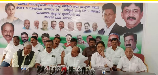
ಸಲ ನಡೆಸಿದರು ಅಚ್ಚರಿ ಇಲ್ಲ ಎಂದರು. ಮೈತ್ರಿ ಮಾಡಿಕೊಂಡಿರುವುದನ್ನು ನರೇಂದ್ರ ಮೋದಿ ಆಡಳಿತದಲ್ಲಿ ದೇಶದಲ್ಲಿ ಮಿಲಿಟರಿ ಆಡಳಿತ ತರಲು ಹೋರಾಟದ್ದಾರೆ. ಇದೇನು ಜನ ಪ್ರಣಾಳಿಕೆಯಲ್ಲಿ ಮೋದಿ ಗ್ಯಾರಂಟಿ ಎಂದು ನಮೂದಿಸಿದ್ದಾರೆ. ಪ್ರಜಾಪ್ರಭುತ್ವ ವ್ಯವಸ್ಥೆಯನ್ನು ಬದಲಾವಣೆ ಮಾಡುತ್ತಿದ್ದಾರೆ. ಜೆಡಿಎಸ್ ಜೊತೆಗೆ

ಬೆಳಗಾವಿ: ತಂತ್ರಜ್ಞಾನ ಯುಗದಲ್ಲಿ ದೇಶಾದ್ಯಂತ ಏಕಕಾಲಕ್ಕೆ ಚುನಾವಣೆ ನಡೆಸಬಹುದಿತ್ತು. ಆದನ್ನೆಲ್ಲ ಬಿಟ್ಟು ಕಾಶ್ಮೀರದಿಂದ ಕರ್ನಾಟಕದವರೆಗೂ ಚುನಾವಣೆಯ ಪ್ರಚಾರ ನಡೆಸಲು ಅನುಕೂಲ ಮಾಡಿಕೊಳ್ಳುವ ಸಲುವಾಗಿ 7 ಹಂತದಲ್ಲಿ ಮತದಾನ ನಡೆಸಲಾಗುತ್ತಿದೆ. ಬಿಜೆಪಿಗರು ಅವರಿಗೆ ಬೇಕಾದ ಹಾಗೇ ಚುನಾವಣೆ ನಡೆಸುತ್ತಿದ್ದಾರೆ ಎಂದು ಮಾಜಿ ಸಿಎಂ ವೀರಪ್ಪ ಮೊಯ್ಲಿ ಕಿಡಿಕಾರಿದರು. ಇಲ್ಲಿನ ಜಿಲ್ಲಾ ಕಾಂಗ್ರೆಸ್ ಭವನದಲ್ಲಿ ಗುರುವಾರ ಸುದ್ದಿಗೋಷ್ಠಿಯಲ್ಲಿ ತರಲು ಮಾತನಾಡಿ, ಲೋಕಸಭಾ ಚುನಾವಣೆ ರಾಷ್ಟ್ರದ ಮಹತ್ವದ ಚುನಾವಣೆಯಾಗಿದೆ. ಪ್ರಧಾನಿ ನರೇಂದ್ರ ಮೋದಿ ಅವರೇ ಮುಂದುವರಿಸಿಕೊಂಡು ಹೋದರೆ ಎಲ್ಲಾ ಚುನಾವಣೆ ಒಂದೇ