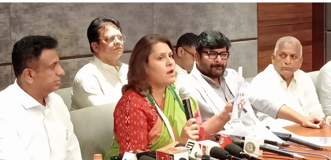
ಇಲ್ಲಿನ ಬಾಸಗಿ ಹೋಟೆಲ್ ನಲ್ಲಿ ಮಂಗಳವಾರ ಸುದ್ದಿಗೋಷ್ಠಿಯಲ್ಲಿ ಮಾತನಾಡಿದ ಅವರು, ಬಿಜೆಪಿ ನಾಯಕರಿಗೆ ಹಾಗೂ ಪ್ರಧಾನಿ ಮೋದಿಯವರಿಗೆ ಪ್ರಜ್ಞಲ್ ರೇವಣ್ಣ ಮಾಡಿರುವ ಕೃತ್ಯದ ಬಗ್ಗೆ ಮಾಹಿತಿ ಇತ್ತು ಆದರೂ, ಹಾಸನ ಟಿಕೆಟ್ ನೀಡಿ ಮೈಸೂರಿನಲ್ಲಿ ಬಿಜೆಪಿ ಸಮಾವೇಶದಲ್ಲಿ ಪ್ರಜ್ಞಲ್ ರೇವಣ್ಣನ ಬೆನ್ನು ತಟ್ಟಿ ಮತ ನೀಡುವಂತೆ ಯಾವ ಮುಖ ಇಟ್ಟುಕೊಂಡು ಮತಯಾಚನೆ ಮಾಡಿದರು ಎಂದು ಪ್ರಶ್ನಿಸಿದರು. ಮಹಿಳೆಯರ ಸ್ವಾಭಿಮಾನ ಮತ್ತು ಅವರ ಸುರಕ್ಷತೆ ಅಪಾಯದಲ್ಲಿದೆ. ಸಾವಿರಾರು ಮಹಿಳೆಯರ ಮೇಲೆ ದೌರ್ಜನ್ಯ ನಡೆದಿದೆ ಪ್ರಜ್ಞಲ್ ಬಗ್ಗೆ ಪ್ರಧಾನಿ ಮೋದಿಯವರು ಚಕಾರವತ್ತಿಲ್ಲ. ಅವರ ಬೆನ್ನಿಗೆ ನಿಂತವರು ಯಾರು ಎಂದು ಆಕ್ರೋಶ ಹೊರಹಾಕಿದರು. ಪ್ರಜ್ಞಲ್ ರೇವಣ್ಣನ ಪ್ರಕರಣದ ಕುರಿತು ಯಾವ ಕೇಂದ್ರ ಸಚಿವರು ಮಾತನಾಡದೆ ಇರುವುದು ವಿಶಯಾಸದ ಸಂಗತಿ ಎಂದು. ರಾಕ್ಷಸ ಪ್ರವೃತ್ತಿ ಇರುವ ಜೆಡಿಎಸ್ ಪಕ್ಷದ ಸಮಿತಿಗಳನ್ನು ಮಾಡಿಕೊಂಡಿರುವ ಮೋದಿ ಅವರು ಇದಕ್ಕೆ ಉತ್ತರ ನೀಡಬೇಕಿದೆ. ಪ್ರಧಾನಿ ಮೋದಿಯವರ ಅಭಿಪ್ರಾಯ ಬಗ್ಗೆ ಹೊಗಳಿಕೊಳ್ಳುತ್ತಾರೆ ಆದರೆ, ಸಾವಿರಾರು ಮಹಿಳೆಯರ ಮನ ಹಾನಿಯಾಗಿದೆ. ಇದೇನಾ ಬಿಜೆಪಿ ಬದ್ಧತೆ ಎಂದು ಚಾಚಿ ಬೀಸಿದರು. ದೇಶದಲ್ಲಿ ಮಹಿಳೆಯರಿಗೆ ಭದ್ರತೆ ಇಲ್ಲದಾಗಿದೆ. ಜೆಡಿಎಸ್ ಜತೆ ಕೈ ಜೋಡಿಸಿದ ಬಿಜೆಪಿಗರಿಗೆ ಇರುವ ಕೈಯನ್ನು ಹೇಗೆ ಇಟ್ಟುಕೊಳ್ಳಬೇಕು ಎಂದು ಅಪಾರಾಧ. ವಿಡಿಯೋ ಬಿಡುಗಡೆಯಾದ ಅಪರಾಧ. ವಿಡಿಯೋ ಬಿಡುಗಡೆಯಾದ ಅಪರಾಧ. ವಿಡಿಯೋ ಬಿಡುಗಡೆಯಾದ ಅಪರಾಧ. ವಿಡಿಯೋ ಬಿಡುಗಡೆಯಾದ ಅಪರಾಧ.