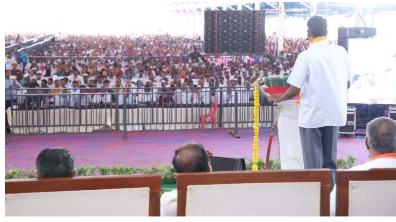
ಅಭ್ಯರ್ಥಿ ಗೆಲುವಿಗೆ ಎಲ್ಲರೂ ಸಹ-ರಿಸಬೇಕು. ಎಲ್ಲರೂ ಕಂಠಣ ಬದ್ಧರಾಗಿ, ಮತ ಕೇಳಲು ನಮಗೆ ನೈತಿಕ ಹಕ್ಕಿದೆ. ಏಕೆಂದರೆ, ಚುನಾವಣೆಗೂ ಮೊದಲು ಕಾಂಗ್ರೆಸ್ ಪಕ್ಷ ಕೊಟ್ಟಿದ್ದ ಗ್ಯಾರಂಟಿ ಯೋಜನೆಗಳನ್ನು ಜಾರಿಗೆ ತಂದಿದ್ದೇವೆ. ಓಗಣಿ ನಮಗೆ ನೈತಿಕತೆ ಇದೆ ಎಂದು ಹೇಳಿದರು. 2014ರಲ್ಲಿ ವಿವಿಧ ಆಶ್ವಾಸಗಳನ್ನು ಕೊಟ್ಟು ಅಧಿಕಾರಕ್ಕೆರಿದ್ದ ಬಿಜೆಪಿ ಒಂದೇ ಒಂದು ಭರವಸೆಯನ್ನು ಈಡೇರಿಸಿಲ್ಲ. ಸ್ವಿಸ್ ಬ್ಯಾಂಕ್ ನಲ್ಲಿರುವ ಹಣ

ಗೋಕಾಕ್ ನಲ್ಲಿ ಮಂಗಳವಾರ ನಡೆದ ಪ್ರಜಾಧ್ವನಿ ಕಾರ್ಯಕ್ರಮದಲ್ಲಿ ಮಾತನಾಡಿದ ಅವರು, ಕಾಂಗ್ರೆಸ್