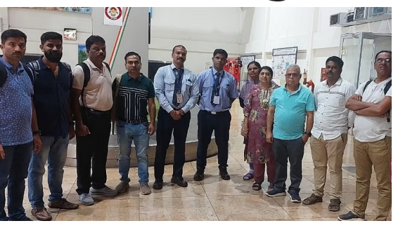
ಬೆಂಗಳೂರಿನಿಂದ ಸಾಂಪ್ರದಾಯಿಕ ವಿಮಾನ ನಿಲ್ದಾಣಕ್ಕೆ ಬಂದಿಳಿದ ಪ್ರಯಾಣಿಕರು ತಮ್ಮ ಲಗೇಜ್‌ಗಳನ್ನು ಇಲ್ಲದ ಪರದಾಡಿದರು

ಬೆಳಗಾವಿ: ಬೆಂಗಳೂರಿನಿಂದ ಇಲ್ಲಿನ ಸಾಂಪ್ರದಾಯಿಕ ವಿಮಾನ ನಿಲ್ದಾಣಕ್ಕೆ ಭಾನುವಾರ ಸಂಜೆ ಬಂದಿಳಿದ ಇಂದಿಗೊ ಸಂಸ್ಥೆಯ ವಿಮಾನದಲ್ಲಿ ಪ್ರಯಾಣಿಕರ 20 ಕ್ಕೂ ಅಧಿಕ ಲಗೇಜ್‌ಗಳನ್ನು ಬೆಂಗಳೂರಿನಲ್ಲೇ ಬಿಟ್ಟುಬರಲಾಗಿತ್ತು.