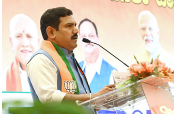
ಗ್ಯಾರಂಟಿ ಯೋಜನೆಗಳ ಬಗ್ಗೆ ಟೀಕೆ: ಬಿ ವೈ ವಿಜಯೇಂದ್ರ ವಿರುದ್ಧ ಚುನಾವಣಾ ಆಯೋಗಕ್ಕೆ ಕಾಂಗ್ರೆಸ್ ದೂರು

ಬೆಂಗಳೂರು: ಸಿದ್ಧರಾಮಯ್ಯ ನೇತೃತ್ವದ ಸರ್ಕಾರದ ಗ್ಯಾರಂಟಿ ಯೋಜನೆಗಳನ್ನು ಟೀಕಿಸಿದ ಬಿಜೆಪಿ ರಾಜ್ಯಾಧ್ಯಕ್ಷ ಬಿ ವೈ ವಿಜಯೇಂದ್ರ ವಿರುದ್ಧ ಕಾನೂನು ಕ್ರಮ ಜರುಗಿಸುವಂತೆ ಕರ್ನಾಟಕ ಪ್ರದೇಶ ಕಾಂಗ್ರೆಸ್ ಸಮಿತಿ(ಕೆಪಿಸಿಸಿ) ಶನಿವಾರ ಚುನಾವಣಾ ಆಯೋಗಕ್ಕೆ ದೂರು ನೀಡಿದೆ.