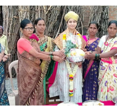
ಪಕ್ಷ ಅಪಾರ ಕೊಡುಗೆ ನೀಡಿದೆ. ಬ್ಯಾಂಕ್ ರಾಷ್ಟ್ರೀಕರಣ, ಗರಿಬಿ ಹಠಾಪೋ, ನೀರಾವರಿ, ರಸ್ತೆಗಳು, ಶಾಲಾ ಕಾಲೇಜು, ವಿಶ್ವ ವಿದ್ಯಾಲಯಗಳು, ಇನ್ನೂ ಸಂಸ್ಥೆ ಕಟ್ಟುವಂತಹ ಹಲವಾರು ಕೆಲಸಗಳನ್ನು ಗ್ರಾಮದಲ್ಲಿ ಹಮ್ಮಿಕೊಂಡ ಲೋಕಸಭೆಯ ಚುನಾವಣಾ ಪ್ರಚಾರ ಸಭೆಯಲ್ಲಿ ಅವರು ಮಾತನಾಡಿ, ದೇಶ ಕಟ್ಟುವಲ್ಲಿ ಕಾಂಗ್ರೆಸ್ ಯಮಕೋಮರಡಿ ಕ್ಷೇತ್ರವನ್ನು ಅಭಿವೃದ್ಧಿಯತ್ತ ಕೊಂಡೊಯ್ಯಲಾಗುತ್ತಿದೆ. ಕಾಂಗ್ರೆಸ್ ದೇಶಕ್ಕೆ ಸ್ವಾತಂತ್ರ್ಯ ತಂದುಕೊಟ್ಟಂತೆ

ಬೆಳಗಾವಿ: ಕಾಂಗ್ರೆಸ್ ಪಂಚದ ಗ್ಯಾರಂಟಿಗಾಗಿ ಜೊತೆಗೆ ನಮ್ಮ ತಂದೆಯವರಾದ ಸತೀಶ ಜಾರಕಿಹೊಳೆಯವರು ಕ್ಷೇತ್ರದಲ್ಲಿ ಮಾಡಿದ ಅಭಿವೃದ್ಧಿ ಕಾಮಗಾರಿಗಳು ನಮಗೆ ಶ್ರೀರಕ್ಷೆಯಾಗಲಿವೆ. ಆದ್ದರಿಂದ ಮತದಾರರು ದೃಢ ನಿರ್ಧಾರ ಮಾಡಿ 'ಕೈ' ಗೆ ಶಕ್ತಿ ನೀಡಬೇಕು ಚಿಕ್ಕೋಡಿ ಲೋಕಸಭಾ ಕಾಂಗ್ರೆಸ್ ಅಭ್ಯರ್ಥಿ ಪ್ರಿಯಂಕಾ ಜಾರಕಿಹೊಳೆ ಮನವಿ ಮಾಡಿದರು.