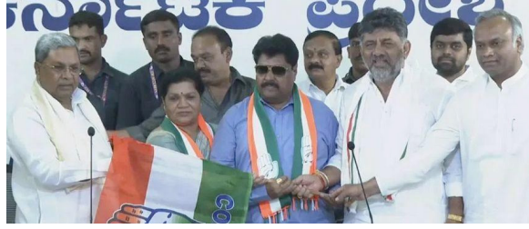
ನಡೆಸಿಕೊಂಡ ಬಗ್ಗೆ ಬಹಳ ನೋವಿನಿಂದ ಬಿಜೆಪಿಯಿಂದ ಬಿಜೆಪಿ ತೊರೆದು ಮರಳಿ ಗಾಡಿಗೆ ಕಾಂಗ್ರೆಸ್ ಸೇರ್ಪಡೆಯಾಗಿದ್ದಾರೆ.