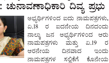
ಅಭ್ಯರ್ಥಿಗಳಿಂದ ಐದು ನಾಮಪತ್ರಗಳು, 18 ರ ಐದನೇಯ ದಿನದಂದು ನಾಲ್ಕು ಜನ ಅಭ್ಯರ್ಥಿಗಳಿಂದ ಆರು ನಾಮಪತ್ರಗಳು ಮತ್ತು 19 ರ ಅರನೇಯ ದಿನದಂದು ಇಂದು ನಾಮಪತ್ರಗಳ ಸಲ್ಲಿಕೆಗೆ ಕೊನೆಯ ದಿನವಾಗಿದ್ದು, 11 ಜನ ಅಭ್ಯರ್ಥಿಗಳಿಂದ 12 ನಾಮಪತ್ರಗಳು ಸಲ್ಲಿಕೆ ಆಗಿವೆ.