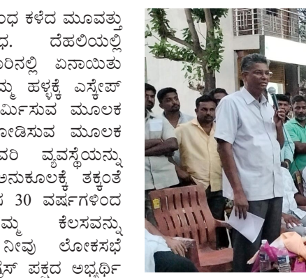
ತಿಳಿಸಬೇಕೆಂದರು. ನರೇಂದ್ರ ಮೋದಿ ಎರಡು ಬಾರಿ ಈ ಪ್ರಧಾನಿಯಾದರು. ಗುಜರಾತ್ ಮಾದರಿ ಅಭಿವೃದ್ಧಿ ಮಾಡಿಬಿಡುತ್ತೇವೆ ಎಂದು ಹೇಳಿದ್ದರು. ಆದರೆ, ಪ್ರಮುಖ ಭರವಸೆಗಳನ್ನು ಕೂಡ ಈಡೇರಿಸಲಿಲ್ಲ. ಪ್ರತಿಯೊಬ್ಬರಿಗೂ 15 ಲಕ್ಷ ರೂ. ಕೊಡುತ್ತೇನೆ ಎಂದಿದ್ದರು. ಎರಡು ಕೋಟಿ ಯುವಕರಿಗೆ ಉದ್ಯೋಗ ಸೃಷ್ಟಿಸುತ್ತೇನೆಂದು ತಿಳಿಸಿದ್ದರು. ಆದರೆ, ಈಗ

ರಾಯಚೂರು: ನಿಮ್ಮ ಕೆಲಸ, ಕಾರ್ಯಗಳನ್ನು ಮಾಡುವ, ನಿಮ್ಮ ಸಮಸ್ಯೆಗಳಿಗೆ ಪ್ರಾಮಾಣಿಕವಾಗಿ ಸ್ಪಂದಿಸುವವರನ್ನು, ನೀವು ಆಯ್ಕೆ ಮಾಡಬೇಕು ಹೊರತು ಸಂಸದರಾಗಿ ಆಯ್ಕೆಯಾಗಿ ನಿಮ್ಮ ನೀರಿಗೆ ಒಂದೇ ಒಂದು ಬಾರಿಯೂ ಭೇಟಿ ನೀಡದ ಕಾಲಿ ಸಂಸದ ಅಕ್ಟಾಪಾಟ್ ಜೊಲ್ಲೆಯವರಂತವರನ್ನು ಎಂದು ಲೋಕೋಪಯೋಗಿ ಇಲಾಖೆ ಹಾಗೂ ಬೆಳಗಾವಿ ಜಿಲ್ಲಾ ಉಸ್ತುವಾರಿ ಸಚಿವ ಸತೀಶ್ ಜಾರಕಿಹೊಳೆ ಅವರು ಹೇಳಿದರು.