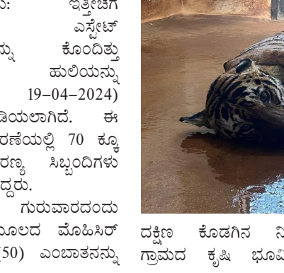
ದಕ್ಷಿಣ ಕೊಡಗಿನ ನಿಟ್ಟೂರು ಹುಲಿ ಕೊಂದಿತ್ತು. ಗ್ರಾಮದ ಕೃಷಿ ಭೂಮಿಯಲ್ಲಿ ಘಟನೆಯಿಂದ ಅತಂಕಗೊಂಡ

ರೈತರು ಮತ್ತು ಗ್ರಾಮಸ್ಥರು ಪ್ರತಿಭಟನೆ ನಡೆಸಿ ತಕ್ಷಣವೇ ಹುಲಿಯನ್ನು ಹಿಡಿಯುವಂತೆ ಒತ್ತಾಯಿಸಿದರು. ಇದರ ಬೆನ್ನಲ್ಲೇ ಅರಣ್ಯ ಇಲಾಖೆ ತಕ್ಷಣ ಕ್ರಮ ಕೈಗೊಂಡಿದ್ದು, ಶುಕ್ರವಾರ ಅರಣ್ಯ ಇಲಾಖೆಯ ಅರಂಭದ ಕೂಂಬಿಂಗ್ ಮತ್ತು ಸೆರೆ ಕಾರ್ಯಾಚರಣೆಯಲ್ಲಿ ಒಟ್ಟು 76 ಕಾಡಾನಿಗಳು ಭಾಗಿಯಾಗಿದ್ದವು. "ನಾವು ಸಂಘರ್ಷವಿಲ್ಲ