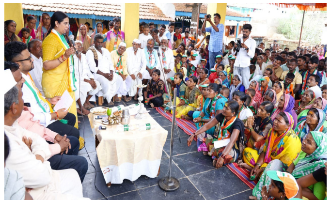
ಜನ ಸಂಪರ್ಕಕ್ಕೆ ಸಿಲುಕಿದ್ದಾರೆ. ಕೊಟ್ಟ ಮಾತಿನಂತೆ ನಡೆದಿದ್ದೇವೆ ಎಂದು ಹೇಳಿದರು. ಅಂಗನವಾಡಿ ಕೇಂದ್ರಗಳನ್ನು ಆರಂಭಿಸಿದ್ದು, ಆತಾ ಕಾರ್ಯಕರ್ತರ ಸಂಬಳ ಜಾಸ್ತಿ ಮಾಡಿದ್ದು ಕೂಡ