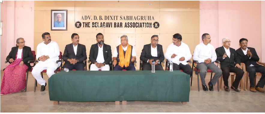
ಅವರು,ದೇಶದ ದಶದಿಕ್ಕಿನಲ್ಲಿ ಬಿಜೆಪಿ ಅಭಿವೃದ್ಧಿ ಮಾಡಿದೆ. ದಿ. ಸುರೇಶ ಅಂಗಡಿಯವರ ಅಭಿವೃದ್ಧಿಯ ಕಾರ್ಯಗಳು ಉದಾಹರಣೆ ಇವೆ. ಬೆಳಗಾವಿ ಜನತೆಯ ಕನಸು ಈಡೇ-

ಬೆಳಗಾವಿ: ದೇಶದಲ್ಲಿ ನರೇಂದ್ರ ಮೋದಿಯವರು ಮಗದೊಮ್ಮೆ ಪ್ರಧಾನಿ ಆಗಬೇಕು. 10 ವರ್ಷದ ಅವಧಿಯಲ್ಲಿ ಸ್ವಲ್ಪ ಆಡಳಿತ ಶ್ರೇಷ್ಠ ನಾಯಕ ಮೋದಿ ಅವರು, ಇಲ್ಲಿವರೆಗೂ ಒಂದೇ ಒಂದು ಭ್ರಷ್ಟಾಚಾರ ಆಗಿಲ್ಲ. ದೇಶದ ಹಿತಕ್ಕಾಗಿ ಬಿಜೆಪಿಯನ್ನು ಬಹುಮತ ಅಂತರದಿಂದ ಗೆಲ್ಲಬೇಕು ಎಂದು ಬಿಜೆಪಿ ಅಭ್ಯರ್ಥಿ ಜಗದೀಶ್ ಶೆಟ್ಟರ್ ಹೇಳಿದರು.