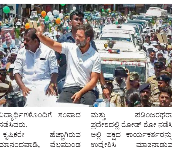
ವಿದ್ಯಾರ್ಥಿಗಳೊಂದಿಗೆ ಸಂವಾದ ಮತ್ತು ಪರಿಷರಫರಾ ಪ್ರದೇಶದಲ್ಲಿ ರೋಡ್ ಶೋ ನಡೆಸಿ

ವಯನಾಡು: ತಮ್ಮ ಸಂಸದೀಯ ಕ್ಷೇತ್ರ ಕೇರಳದ ವಯನಾಡಿನಲ್ಲಿ ಕಾಂಗ್ರೆಸ್ ನಾಯಕ ರಾಹುಲ್ ಗಾಂಧಿ ಸೋಮವಾರ ಭರ್ಜರಿ ರೋಡ್ ಶೋ ನಡೆಸಿದ್ದಾರೆ. ಸುಲ್ತಾನ್ ಬತ್ತೇರಿ ಪ್ರದೇಶದಲ್ಲಿ ಕಾರಿನ ಮೇಲೆ ಕುಳಿತು ರಾಹುಲ್ ಗಾಂಧಿ ರೋಡ್ ಶೋ ನಡೆಸಿದ್ದು ರಸ್ತೆಯ ಇಕ್ಕೆಲಗಳಲ್ಲಿ ನೂರಾರು ಕಾರ್ಯಕರ್ತರು ನೆರೆದಿದ್ದರು. ರೋಡ್ ಶೋಗೂ ಮೊದಲು ತಮಿಳುನಾಡಿನ ಗಡಿಭಾಗದ ನಿಲೇಗುರಿ ಜಿಲ್ಲೆಗೆ ತೆರಳಿ, ಅಲ್ಲಿನ ಕಲಾ ಮತ್ತು ವಿಜ್ಞಾನ ಕಾಲೇಜಿನಲ್ಲಿ