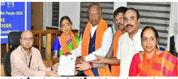
ಶಿವಮೊಗ್ಗದಿಂದ ಪಕ್ಕೇತರ ಅಭ್ಯರ್ಥಿಯಾಗಿ ನಾಮಪತ್ರ ಸಲ್ಲಿಸಿದ ಈಶ್ವರಪ್ಪ

ಶಿವಮೊಗ್ಗ: ಪ್ರತಿನಿಧಿ ಹಾವೇರಿ ಲೋಕಸಭಾ ಕ್ಷೇತ್ರದ ಬಿಜೆಪಿ ಟಿಕೆಟ್ ಸಿಗದ ಹಿನ್ನೆಲೆಯಲ್ಲಿ ಅಸಮಾಧಾನಗೊಂಡಿರುವ ಮಾಜಿ ಸಚಿವ ಕೆ.ಎಸ್.ಈಶ್ವರಪ್ಪ, ಇದೀಗ ಬಿಜೆಪಿ ಬಂಡಾಯ ಅಭ್ಯರ್ಥಿಯಾಗಿ ಶಿವಮೊಗ್ಗ ಲೋಕಸಭಾ ಕ್ಷೇತ್ರದಿಂದ ಕಣಕ್ಕಿಳಿದಿದ್ದಾರೆ.