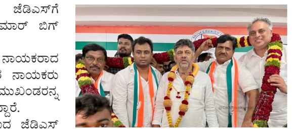
ಕುಮಾರಸ್ವಾಮಿ ಅವರಿಗೆ ಕೊಟ್ಟ ಪರಿಣಾಮ ಆ ಪಕ್ಷ ಈ ಸ್ಥಿತಿ ತಲುಪಿದೆ. ಈಗ ತಮ್ಮನ್ನು ಅಧಿಕಾರದಿಂದ ಕೆಳಗೆ ಇಳಿಸಿದವರನ್ನೇ ಕರೆದುಕೊಂಡು ಒಕ್ಕುಗಿರ ಮಠಕ್ಕೆ ಹೋಗಿದ್ದಾರೆ. ಕುಮಾರಸ್ವಾಮಿ ಅವರು ಅಧಿಕಾರದಲ್ಲಿದ್ದಾಗ ತಮ್ಮ ಪಕ್ಷದ ಕಾರ್ಯಕರ್ತರಿಗೆ ಒಂದು ಸಣ್ಣ ಅಧಿಕಾರವನ್ನಾದರೂ ಕೊಟ್ಟಾರಾ? ಅಧಿಕಾರ ಇದ್ದಾಗಲೇ ಏನು ಮಾಡಲಿಲ್ಲ. ಕಾರ್ಯಕರ್ತರು ಇಲ್ಲದ ಯಾವ ಪಕ್ಷ ಇರಲು ಸಾಧ್ಯ? ಎಂದು ಪ್ರಶ್ನಿಸಿದರು.