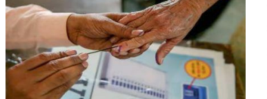
85 ವರ್ಷ ಮೇಲ್ಪಟ್ಟ 6206 ಮತದಾರರು ಹಾಗೂ ವಿಶೇಷ ಚೇತನರು 201 ಮತದಾರರು ಅಂಚೆ ಮತದಾನ ಮಾಡಲು ನೋಂದಣಿ ಮಾಡಿಕೊಂಡಿದ್ದಾರೆ. 85 ವರ್ಷ ಮತ್ತು ಅದಕ್ಕಿಂತ ಹೆಚ್ಚು ವಯಸ್ಸಾದವರು ಹಾಗೂ ವಿಶೇಷ ಚೇತನರಿಗೆ ಏಪ್ರಿಲ್ 13 ರಿಂದ ಏಪ್ರಿಲ್ 18 ರವರೆಗೆ

ಬೆಂಗಳೂರು: ಏ.26 ರಂದು ಮೊದಲ ಹಂತ ನಡೆಯಲಿರುವ ಲೋಕಸಭಾ ಕ್ಷೇತ್ರಗಳಲ್ಲಿ ನಾಳೆಯಿಂದ ಹಿರಿಯ ನಾಗರಿಕರ ಮತದಾನ ನಡೆಯಲಿದೆ. ರಾಜ್ಯದಲ್ಲಿರುವ 85 ವರ್ಷಕ್ಕಿಂತ ಮೇಲ್ಪಟ್ಟ (ಎವಿಎಸ್) ಹಾಗೂ ವಿಶೇಷ ಚೇತನರಿಗೆ (40%ಕ್ಕಿಂತ ಹೆಚ್ಚು ಅಂಗವಿಕಲತೆ) ಗುರುತಿಸಿರುವವರಿಗೆ ಅಂಚೆ ಮತದಾನದ ಮೂಲಕ ಅವಕಾಶ ಕಲ್ಪಿಸಲಾಗಿದೆ.