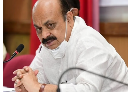
ರಾಜ್ಯ ಈಗ ಕೊಡುತ್ತಿರುವ ಗ್ಯಾರಂಟಿ ಗಳಿಗಂಟಿಯಾಗಿದ್ದಾವೆ. ಗೃಹಪಟ್ಟಿ ಯೋಜನೆ ಎಷ್ಟು ಜರಿಗೆ ತಲುಪಿದೆ. ಬೆಂಗಳೂರು ಬಿಟ್ಟರೆ. ಉರುಗಳಿಗೆ ಬಂದಿಲ್ಲ.

ಹುಬ್ಬಳ್ಳಿ: ಕೇಂದ್ರದಲ್ಲಿ ಅಧಿಕಾರಕ್ಕೆ ಬಂದಿರುವ ಕಾಂಗ್ರೆಸ್ ಸುಳ್ಳು ಗ್ಯಾರಂಟಿಗಳ ಮೂಲಕ ಜನರಿಗೆ ಮೋಸ ಮಾಡುತ್ತಿದೆ. ಸ್ವತಃ ಬಲದಿಂದ ಅಧಿಕಾರಕ್ಕೆ ಬರಲು ಸಾಕಷ್ಟು ಸ್ಥಾನಗಳಲ್ಲಿ ಸ್ಪರ್ಧಿಸದ ಕಾಂಗ್ರೆಸ್, ಮತದಾರರನ್ನು ಮೂರ್ಖರನ್ನಾಗಿಸಿ ಅಲ್ಲೊಂದು ಇಲ್ಲೊಂದು ಸ್ಥಾನ ಗೆಲ್ಲಲು ದೊಡ್ಡ ಆಶ್ಚರ್ಯ ನೀಡುತ್ತಿದೆ ಎಂದು ಮಾಜಿ ಮುಖ್ಯಮಂತ್ರಿ ಬಸವರಾಜ ಬೊಮ್ಮಾಯಿ ವಾಗ್ದಾಳಿ ನಡೆಸಿದ್ದಾರೆ. ಮಾಧ್ಯಮಗಳೊಂದಿಗೆ ಮಾತನಾಡಿದ ಅವರು, ಲೋಕಸಭಾ ಚುನಾವಣೆಯಲ್ಲಿ ಕಾಂಗ್ರೆಸ್ 200 ಸ್ಥಾನಕ್ಕೆ ಸ್ಪರ್ಧಿಸಿ ಸರ್ಕಾರ ಮಾಡುತ್ತೇವೆ ಎನ್ನುತ್ತಾರೆ. ಲೋಕಸಭೆಯ ಎಲ್ಲಾ ಸ್ಥಾನಗಳಲ್ಲಿ ಕಾಂಗ್ರೆಸ್ ಅಭ್ಯರ್ಥಿಗಳನ್ನು ಹಾಕಿ ಸ್ಪರ್ಧಿಸುತ್ತಿಲ್ಲ. ಹೆಚ್ಚಿನ ಸ್ಥಾನಗಳಲ್ಲಿ ಸ್ಪರ್ಧೆ ಮಾಡದೇ ಅವರು ಅಧಿಕಾರಕ್ಕೆ ಹೇಗೆ ಬರುತ್ತಾರೆ? ಎಂದು ಪ್ರಶ್ನಿಸಿದರು.