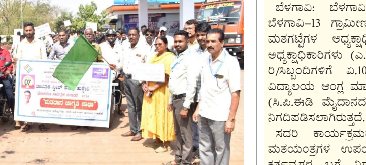
ಅಸೆ ಅಮಿಷಗಳಿಗೆ ಒಳಗಾಗದೇ ನಿರ್ಭಯದಿಂದ ಮತ ಚಲಾಯಿಸಬೇಕು. ಬೈಕ್ ಜಾರಿ ಮೂಲಕ ಪ್ರತಿ ಮನೆ ಮನೆಗೆ ತೆರಳಿ ಮತದಾನ ಕುರಿತು ಅರಿವು ಮೂಡಿಸುವ ಕೆಲಸ ಮಾಡಲಾಗುತ್ತಿದೆ. ಈ ಸಲ ಹೆಚ್ಚು ಪ್ರತಿಭಟನೆ ಮಾಡುವ ಕ್ರಮ ಕೈಗೊಳ್ಳಲಾಗಿದೆ ಎಂದರು.

ಹುಕ್ಕೇರಿ: ಲೋಕಸಭಾ ಸಾರ್ವತ್ರಿಕ ಚುನಾವಣೆ ಪ್ರಯುಕ್ತ ತಾಲೂಕಿನ ಹತ್ತಿರ ಮತ್ತು ಯುವಕನಮರಡಿಯಲ್ಲಿ ಸೋಮವಾರ ಬೈಕ್ ಜಾರಿ ನಡೆಸಲಾಯಿತು.