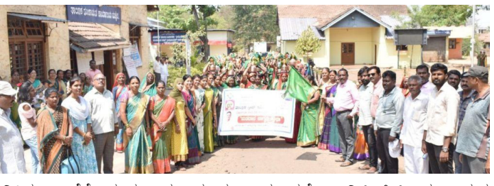
ಎನಿಸಿತು. ಜತೆಗೆ ಸ್ವ-ಸಹಾಯ ಸಂಘ ಸದಸ್ಯೆಯರು, ಗ್ರಾಮ ಕಾರ್ಯಕ ಮಿತ್ರರು ಭಾಗವಹಿಸಿ ಕುಂಭೋತ್ಸವದ ಮರುಗು ಹೆಜ್ಜೆ ಹಾಕಿದರು. ಕುಂಭೋತ್ಸವಕ್ಕೆ ಚಾಲನೆ ನೀಡಿದ ಶಾಪಂ ಇ.ಟಿ.ಆರ್.ಮಲ್ಲಾಡದ ಮಾತನಾಡಿ, ಮತದಾನ ಮಾಡುವುದು ಪ್ರತಿಯೊಬ್ಬ ನಾಗರಿಕನ ಕರ್ತವ್ಯ. ಪ್ರತಿ ಮತವೂ ಅಮೂಲ್ಯವಾದದ್ದು. ಆದ ಕಾರಣ ಎಲ್ಲರೂ ತಪ್ಪದೇ ಮೇ 7 ರಂದು ಮತಗಳಿಟ್ಟಾಗ ಹೋಗಿ ಮತದಾನ ಮಾಡಿ ತಮ್ಮ ಹಕ್ಕನ್ನು ಚಲಾಯಿಸಬೇಕು. ಯಾವುದೇ ಆಸೆ ಅಮಿಷಗಳಿಗೆ ಒಳಗಾಗದೇ ನಿರ್ಭಯದಿಂದ ಮತ ಚಲಾಯಿಸಬೇಕು ಎಂದರು.

ಹುಕ್ಕೇರಿ: ಲೋಕಸಭಾ ಸಾರ್ವತ್ರಿಕ ಚುನಾವಣೆ ಹಿನ್ನೆಲೆಯಲ್ಲಿ ಒಂದಿಲ್ಲೊಂದು ವಿನೂತನ ಯೋಜನೆಗಳನ್ನು ರೂಪಿಸಿ ಮತ ಮಹತ್ವದ ಅರಿವು ಮೂಡಿಸುತ್ತಿರುವ ಹುಕ್ಕೇರಿ ತಾಲೂಕು ಸ್ವೀಪ್ ಸಮಿತಿಯು ಶನಿವಾರ ಮತ್ತೊಂದು ವಿಭಿನ್ನ ಕಾರ್ಯಕ್ರಮ ಆಯೋಜಿಸಿ ಚುನಾವಣಾ ಆಯೋಗದ ಪ್ರಶಂಸೆಗೆ ಪಾತ್ರವಾಯಿತು.