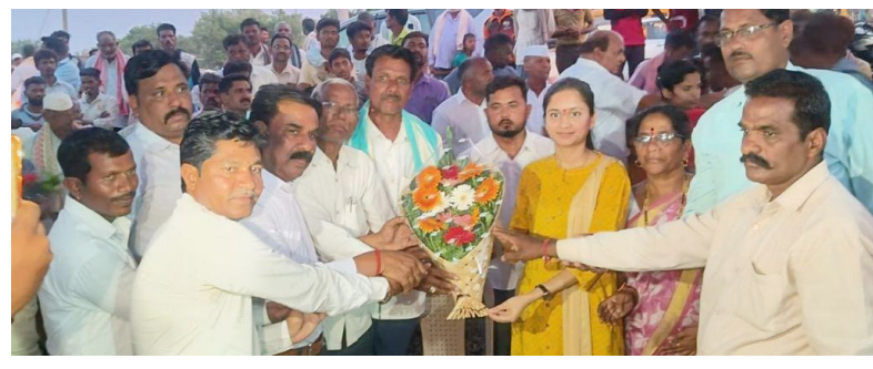
ಬಂದ 10 ತಿಂಗಳಲ್ಲೇ ಘೋಷಿಸಿದ್ದ ಎಲ್ಲಾ ಐದು ಗ್ಯಾರಂಟಿಗಳನ್ನು ಜಾರಿಗೆ ತಂದಿದೆ. ಇದು ನಮ್ಮ ಸರ್ಕಾರದ ಹೆಗ್ಗಳಿಕೆಯಾಗಿದೆ ಎಂದು ಹೇಳಿದರು.

ಮಹಿಳೆಯರಿಗೆ ವಿಶೇಷ ಗ್ಯಾರಂಟಿ ಯೋಜನೆಗಳನ್ನು ಘೋಷಿಸುವುದಾಗಿ ಎಐಸಿಸಿ ಅಧ್ಯಕ್ಷ ಮಲ್ಲಿಕಾರ್ಜುನ ಖರ್ಗೆ, ಪಕ್ಷದ ವರಿಷ್ಠರಾದ ರಾಹುಲ್ ಗಾಂಧಿ, ಸೋನಿಯಾ ಗಾಂಧಿ ಈಗಾಗಲೇ ಪ್ರಕಟಿಸಿದ್ದಾರೆ ಎಂದು ತಿಳಿಸಿದರು.