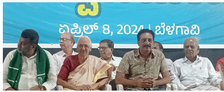
ಇಡೀ ದೇಶವನ್ನು ಮತ್ತೆ ತಮ್ಮ ಕೈವಶ ಮಾಡಿಕೊಳ್ಳಲು ಮಹಾ ಸಂಚು ರೂಪಿಸಿದ್ದಾರೆ. ಅದರ ಪರಿಣಾಮವೇ ಈ ಗ್ರಹಣ ದ್ವೇಷ ರಾಜಕಾರಣ. ಕಪಟ ಮಾಧ್ಯಮ ಹಾಗೂ ಭ್ರಷ್ಟ ಹಣ, ಮೂರನೂ ಬಳಸಿಕೊಂಡು ಅಧಿಕಾರದ ಕೇಂದ್ರಗಳನ್ನು ವಶಪಡಿಸಿಕೊಂಡಿದ್ದಾರೆ ಎಂದು ಆಕ್ರೋಶ ಹೊರಹಾಕಿದರು.