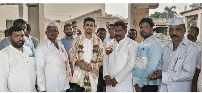
ಬಾಗ್ಯಗಳನ್ನು ಜಾರಿಗೆ ತಂದಿದ್ದಾರೆ ಅಲ್ಲದೆ ಬಡವರ ಹಾಗೂ ವಿದ್ಯಾರ್ಥಿಗಳ ಹಸಿರು ಹೊಟ್ಟೆ ತುಂಬಿಸಲು ಇಂದಿರಾ ಕ್ಯಾಟನ್ ಆರಂಭಿಸಿದರು ಮಹಿಳೆಯರ ಹಾಗೂ ನಿರುದ್ಯೋಗ ಯುವಕರಿಗಾಗಿ ಅನೇಕ ಹೊಸ ಯೋಜನೆಗಳನ್ನು ಜಾರಿಗೆ ತಂದರು ಎಂದರು.