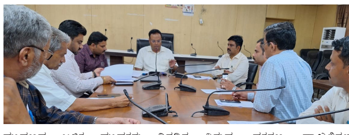
ಮುದ್ರಣದ ಬಳಿಕ ಮುದ್ರಕರು ನಿಗದಿತ ಅಪೆಂಡಿಕ್ಸ್ "ಎ" ಮತ್ತು "ಬಿ" ನಮೂನೆಗಳಲ್ಲಿ ಭರ್ತಿಮಾಡಿ ಮುದ್ರಿತ ಪ್ರತಿಗಳೊಂದಿಗೆ ಸಲ್ಲಿಸಬೇಕು. ಯಾವುದೇ ರೀತಿಯ ಕಾನೂನುಬಾಹಿರ ವಿಷಯಗಳನ್ನು ಮುದ್ರಿಸಬಾರದು. ಜಾತಿ-ಧರ್ಮಗಳು, ಸಮುದಾಯಗಳ ನಡುವೆ ವೈಷಮ್ಯ ಉಂಟು ಮಾಡುವ ವಿಷಯಗಳನ್ನು ಯಾವುದೇ ಕಾರಣಕ್ಕೂ ಮುದ್ರಿಸಬಾರದು ಎಂದು ನಿರ್ದೇಶನ ನೀಡಿದರು. ಮಹಾನಗರ ಪಾಲಿಕೆ, ನಗರ ಸ್ಥಳೀಯ ಸಂಸ್ಥೆಗಳು ಅಥವಾ ಗ್ರಾಮ ಪಂಚಾಯತಿಯಿಂದ ಸೂಕ್ತ ಅನುಮತಿ ಪಡೆಯದೇ ಅನಧಿಕೃತವಾಗಿ ಬ್ಯಾನರ್ ಹಾಗೂ ಪೋಸ್ಟರ್ ಗಳನ್ನು ಅಳವಡಿಸಿದರೆ ಅಂತಹವರ ವಿರುದ್ಧ ಪ್ರಕರಣ ದಾಖಲಿಸಲಾಗುವುದು ಎಂದು ಜಿಲ್ಲಾಧಿಕಾರಿ ಎಚ್ಚರಿಕೆ ನೀಡಿದರು.