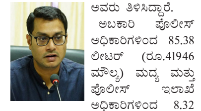
ಲೀಟರ್ (ರೂ.1920 ಮೌಲ್ಯ) ಮತ್ತು ಸೇ-ರಿದಂತೆ ಒಟ್ಟು 89.70 ಲೀಟರ್ ಮದ್ಯ (ರೂ.43,866 ಮೌಲ್ಯ) ವಶಪಡಿಸಿಕೊಂಡು

ಬಳ್ಳಾರಿ: ಲೋಕಸಭೆ ಸಾರ್ವತ್ರಿಕ ಚುನಾವಣೆ ಹಿನ್ನೆಲೆಯಲ್ಲಿ ಮಾದರಿ ನೀತಿ ಸಂಹಿತೆ ಉಲ್ಲಂಘಿಸಿ ಗುರುವಾರ ಸೂಕ್ತ ದಾಖಲೆ ಇಲ್ಲದ ಸಾಗಿಸುತ್ತಿದ್ದ 124 ಸೀರೆ (ರೂ.2,79,100 ಮೌಲ್ಯದ) ಗಳನ್ನು ಜಪ್ತಿ ಮಾಡಿ ಪ್ರಕರಣ ದಾಖಲಿಸಲಾಗಿದೆ ಎಂದು ಜಿಲ್ಲಾ ಚುನಾವಣಾಧಿಕಾರಿ ಹಾಗೂ ಜಿಲ್ಲಾಧಿಕಾರಿ ಪ್ರಶಾಂತ್ ಕುಮಾರ್ ಮಿಶ್ರಾ