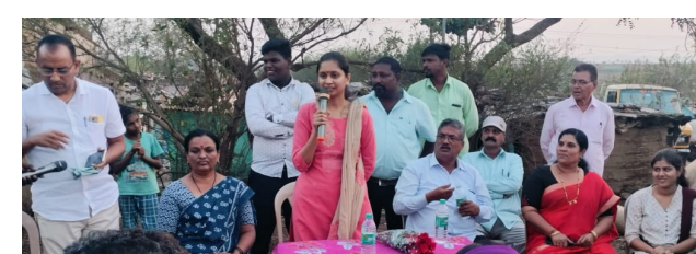
ದೇಶದ ಅಭಿವೃದ್ಧಿ ಮುಖ್ಯ ದೇಶದಲ್ಲಿ ಮದ್ದದ ಹಾಗೂ ಕೆಳವರ್ಗದಲ್ಲಿ ಕೋಟ್ಯಾಂತರ ಜನತೆ ಜೀವನ ಸಾಗಿಸುತ್ತಿದ್ದಾರೆ. ತಾಲೂಕು, ಜಿಲ್ಲೆಗಳು ಅಲ್ಲ ಮಟ್ಟಿಗೆ ಸುದಾರಣೆ ಕಂಡಿವೆ

ಬೆಳಗಾವಿ: ಬಡವರು ಹಾಗೂ ಜನಸಾಮಾನ್ಯರ ಪರ ಕೆಲಸ ಮಾಡಿ ಅವರ ಕುಂದು ಕೊರತೆಗಳಿಗೆ ಸ್ಪಂದಿಸುವಂತಹ ಕಾಂಗ್ರೆಸ್ ಪಕ್ಷಕ್ಕೆ ನಿಮ್ಮ ಅಮೂಲ್ಯವಾದ ನೀಡಬೇಕು ಎಂದು ಚಿಕ್ಕೋಡಿ ಲೋಕಸಭಾ ಕ್ಷೇತ್ರದ ಕಾಂಗ್ರೆಸ್ ಅಭ್ಯರ್ಥಿ ಪ್ರಿಯಂಕಾ ಜಾರಕಿಹೊಳೆ ಅವರು ಹೇಳಿದರು.