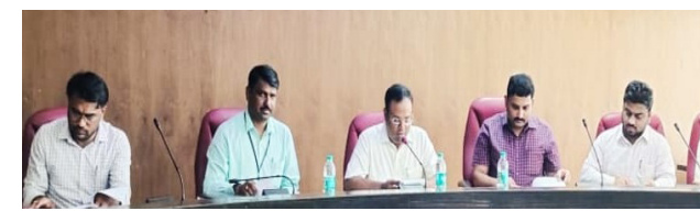
ಲೋಕಸಭಾ ಚುನಾವಣೆಯಲ್ಲಿ ಅನುಮಾನಾಸ್ಪದ ವಹಿವಾಟುಗಳ ಮೇಲೆ ಪ್ರಭಾವ ಬೀರುವ ಅಕ್ರಮ ಯತ್ನಗಳನ್ನು ತಡೆಗಟ್ಟಲು, ಚುನಾವಣಾ ಆಯೋಗವು ಅನುಮಾನಾಸ್ಪದ ಬ್ಯಾಂಕ್ ವಹಿವಾಟುಗಳು ಮತ್ತು ಡಿಜಿಟಲ್ ಪಾವತಿಗಳನ್ನು ಕಟ್ಟುನಿಟ್ಟಾಗಿ ಗಮನಿಸುತ್ತಿದೆ.