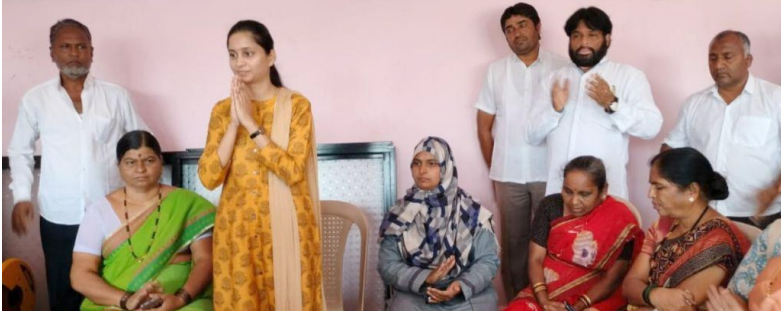
ಮತಯಾಚಿಸಬೇಕೆಂದು ಕಾರ್ಯಕರ್ತರಲ್ಲಿ ಮನವಿ ಮಾಡಿದರು. ಕಾಂಗ್ರೆಸ್ ಸದಾ ಬಡವರ ಪರವಾಗಿದ್ದು, ಚುನಾವಣೆಗೂ ಮುನ್ನ ಘೋಷಿಸಿದ್ದ ಐದು ಗ್ಯಾರಂಟಿ ಯೋಜನೆಗಳನ್ನು ಜಾ-

ಹುಕ್ಕೇರಿ ವಿಧಾನಸಭಾ ಕ್ಷೇತ್ರದ ರುಸ್ತುಪುರ ಗ್ರಾಮದಲ್ಲಿ ಆಯೋಜಿಸಿದ್ದ ಕಾಂಗ್ರೆಸ್ ಪಕ್ಷದ ಕಾರ್ಯಕರ್ತರ ಸಭೆಯಲ್ಲಿ ಭಾಗವಹಿಸಿ ಮಾತನಾಡಿ, ಮತಕ್ಷೇತ್ರದಲ್ಲಿ ಈಗಾಗಲೇ ನಮ್ಮ ತಂದೆಯವರು ಸಾಕಷ್ಟು ಅಭಿವೃದ್ಧಿ ಕಾರ್ಯಗಳನ್ನು ಮಾಡಿ ರಾಜ್ಯದಲ್ಲಿ ಮಾದರಿ ಕ್ಷೇತ್ರವನ್ನಾಗಿ ರೂಪಿಸಿದ್ದಾರೆ.