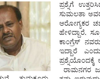
ನಲ್ಲಿ ಪ್ರವಾಸ ಮಾಡುವೆ. ತುಮಕೂರು, ಚಾಮರಾಜನಗರ, ಮೈಸೂರು ಕೋಲಾರ, ಚಿಕ್ಕಬಳ್ಳಾಪುರ ಸೇರಿದಂತೆ 14 ಕಡೆ ಪ್ರಚಾರ ನಡೆಸುತ್ತೇನೆ. ಕರಾವಳಿ ಬಿಟ್ಟು ಎಲ್ಲ ಕಡೆ ಪ್ರಚಾರ ಮಾಡುತ್ತೇನೆ ಎಂದು ಅವರು ಹೇಳಿದರು. ಸುಮಲತಾ ಬೆಂಬಲ ನೀಡುವ ಬಗ್ಗೆ ವಿಶ್ವಾಸ ಇದೀಯಾ ಎಂದು ಕೇಳಲಾದ

ನಮ್ಮ ಮೈತ್ರಿಕೂಟ ಗೆಲ್ಲಬೇಕು. ಯಾವುದೇ ಕ್ಷೇತ್ರದಲ್ಲಿಯೂ ಸಮಸ್ಯೆ ಆಗಬಾರದು. ಹೊಂದಾಣಿಕೆಗೆ ಧಕ್ಕೆ ಆಗಬಾರದು, ಗುರಿ ತಲುಪಲು ಯಾವ ಲೋಪ ಆಗಬಾರದು ಎಂಬ ಉದ್ದೇಶ ನಮ್ಮದು. ಅದಕ್ಕೆ ಪೂರಕವಾಗಿ ಎಲ್ಲ ರೀತಿಯಲ್ಲಿ ಚರ್ಚೆ ಮಾಡೋಣ. ನಂತರ ಸಂಜೆ ಚಿನ್ನಪಟ್ಟಣದಲ್ಲಿ ರೋಡ್ ಶೋದಲ್ಲಿ ಇಬ್ಬರೂ ಭಾಗವಹಿಸುತ್ತೇವೆ. ಇಡಿ ರಾಜ್ಯಕ್ಕೆ ಚಿನ್ನಪಟ್ಟಣದಿಂದಲೇ ಒಂದು ಸ್ಪಷ್ಟ ಸಂದೇಶ ಕೊಡುತ್ತೇವೆ ಎಂದರು ಮಾಜಿ ಮುಖ್ಯಮಂತ್ರಿಗಳು. ನಾನು ಬೆಂಗಳೂರು ಗ್ರಾಮಾಂತರ ಕ್ಷೇತ್ರದಲ್ಲಿ ಪ್ರಚಾರ ಮಾಡುತ್ತೇನೆ. ಕನಕಪುರ, ರಾಮನಗರ, ಚನ್ನಪಟ್ಟಣ, ಕುಣೀಗಲ್