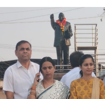
ಶೋ ನಡೆಸಿದರು. 'ಇದಕ್ಕೂ ಮೊದಲು ಕಾರ್ಯಕರ್ತರು ಸಚಿವ ಸತೀಶ್ ಜಾರಕಿಹೊಳೆ, ಕಾಂಗ್ರೆಸ್ ಅಭ್ಯರ್ಥಿ ಪ್ರಿಯಂಕಾ ಜಾರಕಿಹೊಳೆ ಶಾಲೆ ಹೊರಿಸಿ ಸನ್ಮಾನಿಸಿದರು. ಮರವಣಿಗೆ ಉದ್ದಕ್ಕೂ ಸಾವಿರಾರು ಸಂಖ್ಯೆಯಲ್ಲಿ ಪಾಲ್ಗೊಂಡಿದ್ದ ಕಾಂಗ್ರೆಸ್ ಕಾರ್ಯಕರ್ತರು ಪಕ್ಷದ ಧ್ವಜವನ್ನು ಹಿಡಿದು ಕಾಂಗ್ರೆಸ್ ಅಭ್ಯರ್ಥಿಯ ಪರ ಘೋಷಣೆಗಳನ್ನು ಕೂಗಿದರು.

ರಾಯಚೂರು: ಚಿಕ್ಕೋಡಿ ಲೋಕಸಭಾ ಕ್ಷೇತ್ರದ ಕಾಂಗ್ರೆಸ್ ಅಭ್ಯರ್ಥಿ ಪ್ರಿಯಂಕಾ ಜಾರಕಿಹೊಳೆ, ಸಚಿವ ಸತೀಶ್ ಜಾರಕಿಹೊಳೆ ಅವರಿಗೆ ಅಂಬೇಡ್ಕರ್ ವೃತ್ತದಲ್ಲಿ ಅದ್ದೂರಿ ಸ್ವಾಗತ ನೀಡಲಾಯಿತು. ನಗರದಲ್ಲಿರುವ ಡಾ.ಬಿ.ಆರ್. ಅಂಬೇಡ್ಕರ್ ಪ್ರತಿಮೆಗೆ ಸಚಿವ ಸತೀಶ್ ಜಾರಕಿಹೊಳೆ, ಕಾಂಗ್ರೆಸ್ ಅಭ್ಯರ್ಥಿ ಪ್ರಿಯಂಕಾ ಜಾರಕಿಹೊಳೆ, ಸಚಿವ ಲಕ್ಷ್ಮಿ ಹೆಚ್ಚಳಕರ ಸೇರಿದಂತೆ ಹಲವು ಗಣ್ಯರು ಪುಷ್ಪನಮನ ಸಲ್ಲಿಸಿದರು. ಬಳಿಕ, ರಾಯಚೂರು ಪುಷ್ಪನಂದ್ರ ಡಾ.ಬಿ.ಆರ್. ಅಂಬೇಡ್ಕರ್ ವೃತ್ತದಿಂದ ಮಹಾವೀರ ಭವನದವರೆಗೂ ಕಾಂಗ್ರೆಸ್ ಅಭ್ಯರ್ಥಿ ಪ್ರಿಯಂಕಾ ಜಾರಕಿಹೊಳೆ ಅವರು ಕಾಂಗ್ರೆಸ್ ಕಾರ್ಯಕರ್ತರೊಂದಿಗೆ ಭರ್ಜರಿ ರೋಡ್