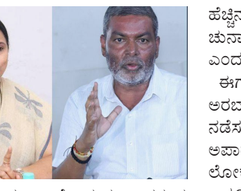
ಹುಡುಕಿಕೊಂಡು ಹೋಗುವ ಪ್ರಸಂಗ ಬರಲಿದೆ ಎಂದು ಉತ್ತರಿಸಿದರು. ರಾಜಕೀಯವಾಗಿ ಮಾತನಾಡಲಿ ಆದರೆ, ವೈಯಕ್ತಿಕ ಟೀಕೆ ಮಾಡುವುದು ಸರಿಯಲ್ಲ. ಗೋಕಾಕ, ಅರಭಾವಿ ಕ್ಷೇತ್ರದಲ್ಲಿ ಕಾಂಗ್ರೆಸ್

ಬೆಂಗಳೂರು: 'ಜಗದೀಶ್ ಶೆಟ್ಟರ್ ಅಡ್ಡೆಸ್ ಕೇಳುವವರು ಲೋಕಸಭಾ ಚುನಾವಣೆ ಬಳಿಕ ಶೆಟ್ಟರ್ ಅಡ್ಡೆಸ್ ಹುಡುಕಿಕೊಂಡು ಬರುವ ಪರಿಸ್ಥಿತಿ ಎದುರಾಗಲಿದೆ' ಎಂದು ಶಾಸಕ ಬಾಲಚಂದ್ರ ಜಾರಕಿಹೊಳೆ ಅವರು ಸಚಿವ ಹೆಚ್ಚಳಕರ ಗೆ ಬದುರೇಟು ನೀಡಿದ್ದಾರೆ. ಸೋಮವಾರ ಸುದ್ದಿಗಾರರೊಂದಿಗೆ ಮಾತನಾಡಿದ ಅವರು, ರಾಜ್ಯವನ್ನು ಮಾಜಿ ಮುಖ್ಯಮಂತ್ರಿ ಬಗ್ಗೆ ಯಾರೂ ಹಗುರವಾಗಿ ಮಾತನಾಡಬಾರದು. ಜಗದೀಶ್ ಶೆಟ್ಟರ್ ಏಳಿಬಿಟ್ಟು ಬಂದು ಅವರ ಅಡ್ಡೆಸ್ ಕೇಳುತ್ತಿರುವುದು ಸಚಿವ ಜಗದೀಶ್ ಶೆಟ್ಟರ್ ಅವರು ಕೇಂದ್ರ ಸಚಿವರಾದ ಬಳಿಕ ಅಡ್ಡೆಸ್