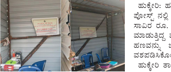
ಹುಕ್ಕೇರಿ: ದಾಖಲೆ ಇಲ್ಲದೆ 1.10 ಸಾವಿರ ರೂ. ಸಾಗಾಟ; ವಶಕ್ಕೆ ಪಡೆದ ಅಧಿಕಾರಿಗಳು

ಇತರ ಇಲಾಖೆ ಸಿಬ್ಬಂದಿಗಳನ್ನು ಆ ಜಾಗಕ್ಕೆ ನೇಮಿಸಬೇಕೆಂಬ ಒತ್ತಾಯಗಳು ಕೇಳಿ ಬರುತ್ತಿವೆ. ಈ ಮೂಲಕ ಭೀಕರ ಬರ ಎಂದು ಸಿಲುಕಿ ಯಾವುದೇ ಅಡಚಣೆಯಾಗದಂತೆ ನೋಡಿಕೊಳ್ಳುವ ಹೊಣೆ ಜಿಲ್ಲಾ ಆಡಳಿತದ ಮೇಲಿದೆ. ಗ್ರಾಮ ಪಂಚಾಯತಿಯ ಯಾವುದೇ