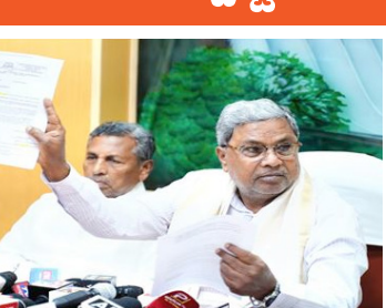
ಕರ್ನಾಟಕದಲ್ಲಿ ಬಿಜೆಪಿ 28 ಸೀಟುಗಳನ್ನು ಗೆಲ್ಲುತ್ತೇವೆ ಎಂದು ಸುಳ್ಳು ಹೇಳುತ್ತಿದ್ದಾರೆ ಎಂದರು.

ಮೈಸೂರು: ತಾವೇ ನಡೆಸಿರುವ ಆಂತರಿಕ ನಮೀಷ್ಕೆಯಲ್ಲಿ ಬಿಜೆಪಿ ಕೇವಲ 200 ಲೋಕಸಭಾ ಸೀಟುಗಳನ್ನು ಗೆಲ್ಲುವುದೂ ಕಷ್ಟ ಎನ್ನುವುದು ಗೊತ್ತಾಗಿದೆ. ಹೀಗಾಗಿ ತಂತ್ರಾಂಶ ಕಾರಣದಿಂದ 400 ಸೀಟು ಗೆಲ್ಲುವುದಾಗಿ ಹೇಳುತ್ತಿದೆ. ದೇಶದ ಜನರನ್ನು ನಿರಂತರವಾಗಿ ಮೂರ್ಖರನ್ನಾಗಿಸುತ್ತೇವೆ ಎಂದು ಹೊರಟವರೇ ಜನರ ಎಂದು ಮೂರ್ಖರಾಗುತ್ತಾರೆ ಎಂದು ಮುಖ್ಯಮಂತ್ರಿ ಸಿದ್ದರಾಮಯ್ಯ ಅವರು ಎಚ್ಚರಿಸಿದರು. ಅವರು ಮೈಸೂರಿನಲ್ಲಿ ಮಾಧ್ಯಮದವರೊಂದಿಗೆ ಮಾತನಾಡಿದರು.