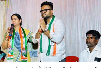
ಒಂದು ವರ್ಷಕ್ಕೆ 60 ಸಾವಿರ ರೂಪಾಯಿ ಸಿಗುತ್ತಿದೆ ಎಂದರು.