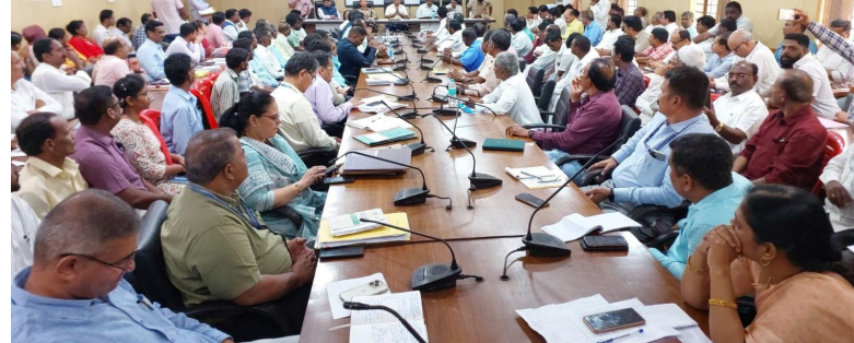
ಕುಡಿಯುವ ನೀರಿನ ವ್ಯವಸ್ಥೆ ಮಾಡಬೇಕು. ಶಿಸ್ತುಬದ್ಧ ಜಯಂತಿ ಆಚರಣೆ ಮಾಡುವುದರ ಮೂಲಕ ಜನರಿಗೆ ಜಯಂತಿಗಳು ಸ್ಫೂರ್ತಿದಾಯಕವಾಗಬೇಕು. ಕೆಲವೆಡೆ ಡಿಜಿ ಗಳಲ್ಲಿ ಅಪಾಯಕಾರಿ ಲೇಸರ್ ಗಳನ್ನು ಬಳಕೆ ಮಾಡುತ್ತಿರುವುದು ಕಂಡುಬರುತ್ತಿದೆ. ಇದರಿಂದ ಕಣ್ಣಿನ ಮೇಲೆ ಪರಿಣಾಮ ಬೀರಿ ಆಸ್ಪತ್ರೆಗೆ ದಾಖಲಾಗಿರುವ ಘಟನೆಗಳು ಕಂಡು ಬಂದಿವೆ ಆದ್ದರಿಂದ ಅಂತಹ ಅಪಾಯಕಾರಿ ಲೇಸರ್ ಬಳಕೆ ಮಾಡಬಾರದು ಎಂದರು.

ಪ್ರತಿ ವರ್ಷ ಡಾ. ಬಾಬಾಸಾಹೇಬ್ ಅಂಬೇಡ್ಕರ್ ಜಯಂತಿ ಅದ್ಭೂತಿಯಾಗಿ ಆಚರಣೆ ಮಾಡಲಾಗುವುದು. ಆದರೆ ಲೋಕಸಭಾ ಚುನಾವಣೆ ಹಿನ್ನೆಲೆಯಲ್ಲಿ ಮಾದರಿ ಮಾದರಿ ನೀತಿ ಸಂಹಿತೆ ಜಾರಿಯಲ್ಲಿರುವ ಕಾರಣ ಮಾರ್ಗಸೂಚಿ ಅನ್ವಯ ಜಯಂತಿ ಆಚರಿಸಬೇಕೆಂದು ತಿಳಿಸಿದರು.