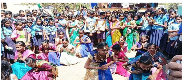
ಅಧ್ಯಕ್ಷಿಯಾಗಿ ಸ್ವಾಗತಿಸಿದರು. ಪ್ರಭುಮವಾಗಿ ಜಾರಾವನ್ನು ಎಚ್.ಕೆ.ಹಳ್ಳಿ(ಹಿರೇಕೆರೆಯಾನಹಳ್ಳಿ) ಗಾವದಲ್ಲಿ ವಿವಿಧ ವೇಷ ಭೂಷಣಗಳನ್ನು ಧರಿಸಿದ ಮೂಲಕ ನೃತ್ಯ, ಹಲಗೆ ಮತ್ತು ಡೋಳು ಕಲಾವಿದರು, ತಾಪಾ ರಾಂಧೋಲ್, ಕರ್ನಾಟಕ ಹಾಗೂ ನಂದಿ ಕೋಲು ಕುಣಿತದ ಕಲಾವಿದರು, ತಾಲಾ ಶಿಕ್ಷಕರು ಮತ್ತು ವಿದ್ಯಾರ್ಥಿಗಳು, ಜನಪ್ರತಿನಿಧಿಗಳು, ಊರಿನ ಮುಖಂಡರು ಹಾಗೂ ಸಾರ್ವಜನಿಕರು

ಬಳ್ಳಾರಿ: ಜಿಲ್ಲೆಯಲ್ಲಿ ನಡೆಯುತ್ತಿರುವ "ಸಂವಿಧಾನ ಜಾಗೃತಿ ಜಾರಾ" ಕಾರ್ಯಕ್ರಮದ ಅಂಗವಾಗಿ ಜಾರಾ-ವು ಸಂಚರಿಸಿರುವ ಗುರುವಾರದಂದು ತಾಲ್ಲೂಕಿನ ಎಚ್.ಕೆ.ಹಳ್ಳಿ, ಕಾಳಿಂಗೇರಿ, ಅಗ್ನಿಹಾರ ಹಾಗೂ ಸೋವನಹಳ್ಳಿ ಗ್ರಾಮ ಪಂಚಾಯತಿಗಳ ಮಾರ್ಗದಲ್ಲಿ ಸಂಚರಿಸಿ, ಸಂವಿಧಾನದ ಆಶಯ ಮತ್ತು ಮೌಲ್ಯಗಳನ್ನು ಕುರಿತು ಸಾರ್ವಜನಿಕರಲ್ಲಿ ಜಾಗೃತಿಯನ್ನು ಮೂಡಿಸಿತು.