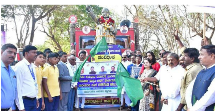
ಜಾಗೃತಿ ಜಾರಾ ಆಯೋಜನೆಯಲ್ಲಿ ಪ್ರಥಮ ಸ್ಥಾನ ಪಡೆದಿದೆ. ಸಂವಿಧಾನ ಜಾಗೃತಿ ಜಾರಾ: ಭಾರತದ ಸಂವಿಧಾನದ ಮಹತ್ವ ಸಂವಿಧಾನವು ನೀಡಿರುವ ಹಕ್ಕು ಸ್ವಾತಂತ್ರ್ಯಗಳು, ಅಧಿಕಾರಗಳು ಮತ್ತು ಸಂವಿಧಾನದಿಂದಲೇ ಭಾರತದ ಮತ್ತು ರಾಜ್ಯದ ಅರ್ಥಿಕ, ಸಾಮಾಜಿಕ, ರಾಜಕೀಯ, ಶೈಕ್ಷಣಿಕ ಮತ್ತು ಸರ್ವಾಂಗೀಣ ಅಭಿವೃದ್ಧಿ ಎಂಬ ಸಂದೇಶವನ್ನು ಎಲ್ಲರಿಗೂ ತಿಳಿಯಪಡಿಸುವ ಅಗತ್ಯವಿದೆ. ಈ ಹಿನ್ನೆಲೆಯಲ್ಲಿ ಜನವರಿ 26, 2024 ರಿಂದ ಫೆಬ್ರವರಿ 24, 2024ರ ವರೆಗೆ ಜಿಲ್ಲೆಗಳಲ್ಲಿನ ಎಲ್ಲಾ ಗ್ರಾಮ ಪಂಚಾಯತಿ ಕೇಂದ್ರ ಸ್ಥಾನದಲ್ಲಿ "ಸಂವಿಧಾನ ಜಾಗೃತಿ ಜಾರಾ" ಕಾರ್ಯಕ್ರಮವನ್ನು ಆಯೋಜಿಸಲಾಗುತ್ತಿತ್ತು.

*ಧಾರವಾಡ(ಕರ್ನಾಟಕ ವಾರ್ತೆ)ಫೆ.23* ಭಾರತ ಸಂವಿಧಾನ ಜಾರಿಗೆ ಬಂದು 75 ವರ್ಷಗಳು ಸಂದ ಹಿನ್ನೆಲೆಯಲ್ಲಿ ರಾಜ್ಯ ಸರ್ಕಾರವು ಸಂವಿಧಾನದ ಮಹತ್ವವನ್ನು ಪ್ರತಿ ಸಾಮಾನ್ಯ ಪ್ರಜೆಗೂ ತಲುಪಿಸುವ ಹಿನ್ನೆಲೆಯಲ್ಲಿ ರಾಜ್ಯದ ಪ್ರತಿ ಜಿಲ್ಲೆಯಲ್ಲಿ ಸಂವಿಧಾನದ ಜಾಗೃತಿ ಜಾರಾ ಕಾರ್ಯಕ್ರಮವನ್ನು ಜಿಲ್ಲಾಡಳಿತದಿಂದ ಆಯೋಜಿಸಲು ಆದೇಶಿಸಿತು.