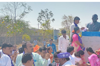
ಪಂಚಾಯತಿ ಮೂಲಕ ಸಂಚರಿಸಿ ಫೆ.16 ರಂದು ಅಥಣಿ ತಾಲೂಕಿನ ಎಲಿ ಹಡಗಲಿ, ಬಡಚಿ, ಕಟಗೇರಿ, ಕೊಟನೂರ, ಸುಟ್ಟಟ್ಟಿ, ಜಂಬಲವಾಡಿ, ನಂದಗಾಂವ, ಶಿರಹಟ್ಟಿ, ಸವಡಿ, ರಡ್ಡೇರಟ್ಟಿ ಮತ್ತು ನಾಗನೂರ ಪಿ.ಕೆ ಗ್ರಾಮ ಪಂಚಾಯತಿಗಳಿಗೆ ತೆರಳಿತು. ಅದೇ ರೀತಿಯಾಗಿ ಎರಡನೇ ಮಾರ್ಗ ದರಥವು ಕತ್ತೂರ ತಾಲೂಕಿನ

ಹಿರೇನಂದಿಹಳ್ಳಿ, ಕಲಬಾವಿ, ತುರಮುರಿ, ಹೂರಕಟ್ಟಿ, ಕಾಡೋಲಿ, ಎಂ.ಕೆ.ಮುಲ್ಲಳ್ಳಿ, ದಾಸ್ತಿಕೊಪ್ಪ, ವೀರಾಪುರ, ಡಿ.ಶೀಲೇಹಳ್ಳಿ ಮತ್ತು ಅಂಬಡಗಲಿ ಗ್ರಾಮ ಪಂಚಾಯತಿಗಳ ಮೂಲಕ ಸಂಚರಿಸಿ ಕತ್ತೂರ ತಾಲೂಕಿನ ತಿಗದೋಲಿ, ಕತ್ತೂರ, ಕುಲವಳ್ಳಿ, ದೇಗಾಂವ, ಬೈಲೂರ ಹಾಗೂ ಪಾನಾಪುರ ತಾಲೂಕಿನ ಕೇರವಾಡಿ, ಲಿಂಗನಮಠ ಮತ್ತು ಗೋಡೋಳಿ ಗ್ರಾಮ ಪಂಚಾಯತಿಗಳಿಗೆ ತೆರಳಿತು.