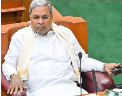
ಆದರೆ ರಾಜ್ಯ ಸರ್ಕಾರ 29,28,910 ರೈತರ ಪಾತೆಗೆ ಬರ ಪರಿಹಾರದ ಮೊದಲ ಕಂತನ್ನು ಜಮೆ ಮಾಡಿದೆ ಎಂದು ತಿಳಿಸಿದ್ದಾರೆ.

ಬೆಲೆ ಏರಿಕೆಯಿಂದಾಗಿ ಸ್ವಲ್ಪಮಟ್ಟಿಗೆ ಸಂಕಷ್ಟವನ್ನು ನಾವು ಕಡಿಮೆ ಮಾಡಿದ್ದೇವೆ. ಆದರೂ ಬಜೆಟ್ ಪರಿವಾರದವರು ಸುಳ್ಳಿನ ಉತ್ತರದಲ್ಲಿ ತೊಡಗಿದ್ದಾರೆ ಎಂದು ಹೇಳಿದ್ದಾರೆ. 2013-18ರ ವರೆಗೆ ನಾವು ಕೊಟ್ಟ ಎಲ್ಲಾ ಧರವಸೆಗಳನ್ನೂ ಈಡೇರಿಸಿದ್ದೇವೆ. ಈ ಬಾರಿ ಚುನಾವಣೆ ವೇಳೆಯಲ್ಲಿ ಕೊಟ್ಟಿದ್ದ ಐದು ಗ್ಯಾರಂಟಿಗಳನ್ನು 8 ತಿಂಗಳ ಒಳಗೆ ಜಾರಿಗೆ ಮಾಡಿದ್ದೇವೆ. ಉಳಿದ ಧರವಸೆಗಳನ್ನೂ ಈಡೇರಿಸುತ್ತೇನೆ ಇದ್ದೇವೆ. ನಮ್ಮ ಗ್ಯಾರಂಟಿ ಯೋಜನೆಗಳ ಫಲಾನುಭವಿಗಳಲ್ಲಿ ಬಜೆಟಿಯವರೂ ಇದ್ದಾರೆ. ಆದರೂ ಬಜೆಟಿಯವರು ಅಭಿವೃದ್ಧಿಗೆ ಹಣ ಇಲ್ಲ ಎಂದು ಸುಳ್ಳುತಾದರಿಕೆ ಉತ್ತರದಲ್ಲಿ ತೊಡಗಿದ್ದಾರೆ ಎಂದು ವಾಗ್ವಾಕ್ಯ ನಡೆಸಿದ್ದಾರೆ. 142 ಕೋಟಿ ಮಹಿಳೆಯರು ಉಚಿತವಾಗಿ ಬಸ್ ಗಳಲ್ಲಿ ಪ್ರಯಾಣಿಸಿದ್ದಾರೆ. ಒಂದು ಕೋಟಿ 50 ಲಕ್ಷ ಮಹಿಳೆಯರಿಗೆ ಅನ್ನಭಾಗ್ಯ, ಗೃಹಲಕ್ಷ್ಮಿ ಯೋಜನೆಗಳು ಅನುಕೂಲಗಳು ತಲುಪುತ್ತಿವೆ. ಒಂದು ಕೋಟಿ 18 ಲಕ್ಷ ಮಂದಿಗೆ ಗೃಹಜ್ಯೋತಿಯ ಅನುಕೂಲಗಳು ಸಿಕ್ಕುತ್ತಿವೆ. ಯುವನಿಧಿಗಾಗಿ ಲಕ್ಷಾಂತರ ಯುವಕ ಯುವತಿಯರು ನೋಂದಣಿ ಮಾಡಿಸಿಕೊಳ್ಳುತ್ತಿದ್ದಾರೆ ಎಂದು ಹೇಳಿದ್ದಾರೆ.