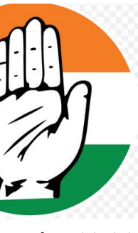
ಬೆಂಗಳೂರು: ಕಳೆದ ಕೆಲವು ದಿನಗಳಿಂದ ಕಾಂಗ್ರೆಸ್ ನಿಗಮ ಮಂಡಳಿಗಳ ನೇಮಕಕ್ಕೆ ಸಂಬಂಧಿಸಿದಂತೆ ಹಲವಾರು ಗೊಂದಲಗಳಿದ್ದವು.

ಬೆಂಗಳೂರು: ಕಳೆದ ಕೆಲವು ದಿನಗಳಿಂದ ಕಾಂಗ್ರೆಸ್ ನಿಗಮ ಮಂಡಳಿಗಳ ನೇಮಕಕ್ಕೆ ಸಂಬಂಧಿಸಿದಂತೆ ಹಲವಾರು ಗೊಂದಲಗಳಿದ್ದವು. ಆದರೆ ಇ ಗೊಂದಲಗಳಿಗೆ ಸಿವಿಂ ಸಿದ್ದರಾಮಯ್ಯ ತೆರೆ ಎಳೆದಿದ್ದು, ಕಳೆದ ಕೆಲವು ದಿನಗಳ ಹಿಂದೆ ರಾಜ್ಯ ಸರ್ಕಾರ 36 ಶಾಸಕರನ್ನು ಮೊದಲ ಪಟ್ಟಿಯಲ್ಲಿ ನಿಗಮ- ಮಂಡಳಿಗಳ ಅಧ್ಯಕ್ಷರುಗಳಾಗಿ ನೇಮಿಸಿತ್ತು. ಇದರ ಬೆನ್ನಲ್ಲೇ 34 ಕಾರ್ಯಕರ್ತರನ್ನು ಒಳಗೊಂಡ 2ನೇ ಪಟ್ಟಿಯೂ ಸಿದ್ಧವಾಗಿ ಬಂದರೆ ದಿನಗಳಲ್ಲಿ ಈ ಕಾರ್ಯಕರ್ತರಿಗೆ ನಿಗಮ-ಮಂಡಳಿ ಅಧ್ಯಕ್ಷ ಹುದ್ದೆ ನೀಡುವ ಕುರಿತು ಅಧಿಸೂಚನೆ ಹೊರಬೀಳುವ ಸಾಧ್ಯತೆಯಿದೆ ಎಂದು ಹೇಳಲಾಗುತ್ತಿದೆ. ಕಾಂಗ್ರೆಸ್ ಹೈಕಮಾಂಡ್ ಒಪ್ಪಿಗೆ ನೀಡಿರುವ 34 ಕಾರ್ಯಕರ್ತರಲ್ಲಿ ಯಾರಿಗೆ ಯಾವ ನಿಗಮ- ಮಂಡಳಿ ಅಧ್ಯಕ್ಷ ಸ್ಥಾನ ನೀಡಬೇಕು ಎಂಬ ಬಗ್ಗೆ ಸೋಮವಾರ ರಾತ್ರಿ ಮುಖ್ಯಮಂತ್ರಿ ಸಿದ್ದರಾಮಯ್ಯ ಹಾಗೂ ಮುಖ್ಯಮಂತ್ರಿ ಡಿ.ಕೆ.ಶಿವಕುಮಾರ್ ಸಭೆ ನಡೆಸಿ ಚರ್ಚಿಸಿದ್ದಾರೆ ಎಂದು ತಿಳಿದುಬಂದಿದೆ. ನಿಗಮ ಮಂಡಳಿಗಳ ಸ್ಥಾನಕ್ಕೆ ಇದೀಗ ಆ ಸ್ಥಾನ