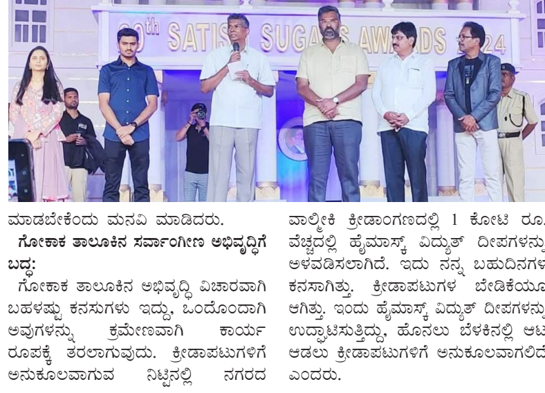
ಮಾಡಬೇಕೆಂದು ಮನವಿ ಮಾಡಿದರು. ಗೋಕಾಕ ತಾಲೂಕಿನ ಸರ್ವಾಂಗೀಣ ಅಭಿವೃದ್ಧಿಗೆ ಬದ್ಧ: ಗೋಕಾಕ ತಾಲೂಕಿನ ಅಭಿವೃದ್ಧಿ ವಿಚಾರವಾಗಿ ಬಹಳಷ್ಟು ಕನಸುಗಳು ಇದ್ದು, ಒಂದೊಂದಾಗಿ ಅವುಗಳನ್ನು ಕ್ರಮೇಣವಾಗಿ ಕಾರ್ಯ ರೂಪಕ್ಕೆ ತರಲಾಗುವುದು. ಕ್ರೀಡಾಪಟುಗಳಿಗೆ ಅನುಕೂಲವಾಗುವ ನಿಟ್ಟಿನಲ್ಲಿ ನಗರದ ವಾಲ್ಮೀಕಿ ಕ್ರೀಡಾಂಗಣದಲ್ಲಿ 1 ಕೋಟಿ ರೂ. ವೆಚ್ಚದಲ್ಲಿ ಹೈಮಾಸ್ಟ್ ವಿದ್ಯುತ್ ದೀಪಗಳನ್ನು ಅಳವಡಿಸಲಾಗಿದೆ. ಇದು ನನ್ನ ಬಹುದಿನಗಳ ಕನಸಾಗಿತ್ತು. ಕ್ರೀಡಾಪಟುಗಳ ಬೇಡಿಕೆಯೂ ಆಗಿತ್ತು. ಇಂದು ಹೈಮಾಸ್ಟ್ ವಿದ್ಯುತ್ ದೀಪಗಳನ್ನು ಉದ್ಘಾಟಿಸುತ್ತಿದ್ದು, ಹೊನಲು ಬೆಳಕಿನಲ್ಲಿ ಆಟ ಆಡಲು ಕ್ರೀಡಾಪಟುಗಳಿಗೆ ಅನುಕೂಲವಾಗಲಿದೆ ಎಂದರು.