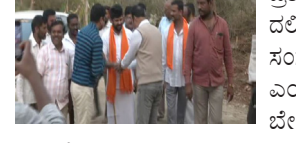
ಪ್ರತಾಪ್ ಸಿಂಹ್ ತೆರಳಿದ್ದವು. ಸಂಸದನಿಗೆ ದಲಿತ ಮುಖಂಡರು ಘೇರಾವ್ ಹಾಕಿದ್ದಾರೆ. ಸಂಸದ ಪ್ರತಾಪ್ ಸಿಂಹ್ ದಲಿತ ಮುಖಂಡರೊಂದಿಗೆ ಏರ್ಪಡಿಸಿದ ಕಾರ್ಯಕ್ರಮದಿಂದ ಬೇಸರದಿಂದ ಕಾರ್ಯಕ್ರಮದಿಂದ ಪ್ರತಾಪ್ ಸಿಂಹ್ ಹೊರಹೋದರು. ಹಾರೋಹಳ್ಳಿ ಗಲಾಟೆ ವಿಚಾರವಾಗಿ ಪ್ರತಿಭಟಿಸಿದ ಸಂಸದ ಪ್ರತಾಪ್ ಸಿಂಹ್, ನಾನು ಈ ಕ್ಷೇತ್ರಕ್ಕೆ ಮುಖಪತ್ರ ದಸರಾ ವಿರೋಧಿ. ಮಹಿಷಾ ದಸರಾ ವಿರೋಧಿ ಮಾಡಿದ್ದಕ್ಕೆ ಯಾರೋ ನಾಲ್ಕು ಜನ ಕಿಡಿಗೇಡಿಗಳು ಗಲಾಟೆ ಮಾಡಿದರು. ಕಾಂಗ್ರೆಸ್ ಪುಡಾಡಿಗಳಿಂದ ಗಲಾಟೆ ನಡೆದಿದೆ ಎಂದು ಆರೋಪಿಸಿದರು.