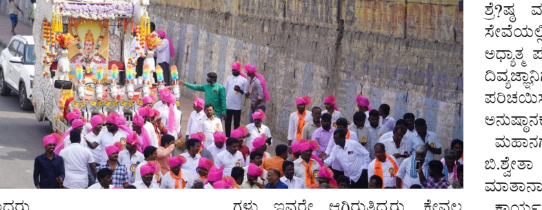
ಅಂದರು. ಸಮುದಾಯದವರಿಗೆ ಕಲ್ಪು, ಬಂಡೆ ಒಡೆಯಲು ಸರ್ಕಾರ ಮತ್ತು ಜಿಲ್ಲಾಡಳಿತದೊಂದಿಗೆ ಚರ್ಚಿಸಿ ಸಂಗನಕಟ್ಟು, ಬಂಡಿಹಟ್ಟಿ ಇತರ ಪ್ರದೇಶಗಳನ್ನು ಗುರುತಿಸಿ ಸರ್ಕಾರ ನಿರ್ಮಿಸುವ ಪ್ರಕಾರ ಅಧಿಕೃತವಾಗಿ ಹಾಗೂ ಮಿತಿಯಾಗಿ ಕಲ್ಪುಬಂಡೆ ಒಡೆಯಲು ಅವಕಾಶ ಕಲ್ಪಿಸಲಾಗುವುದು. ಭೋವಿ ಸಮುದಾಯದವರು ಶೈಕ್ಷಣಿಕವಾಗಿ, ರಾಜಕೀಯವಾಗಿ ಮತ್ತು ಆರ್ಥಿಕವಾಗಿ ಸದೃಢರಾಗಬೇಕು ಎಂದು ಸಲಹೆ ಮಾಡಿದರು. ಕಲ್ಪು, ಮಣ್ಣು, ಸಿಮೆಂಟ್ ಹೊತ್ತು ಮನೆ ಕಟ್ಟುವಂತವರು. ನಮ್ಮ ಕಾಲದ ಇಂಜಿನಿಯರ್ ಗಳು ಇವರೇ ಆಗುತ್ತಿದ್ದರು. ಕೇವಲ ತಮ್ಮ ಯುಕ್ತಿಯಿಂದಲೇ ಸಂಪೂರ್ಣ ಮನೆ ಸುಂದರವಾಗಿ ಕಟ್ಟಲು ಅಡಿಪಾಯ ಹಾಕುತ್ತಿದ್ದರು ಎಂದು ಹೇಳಿದರು.