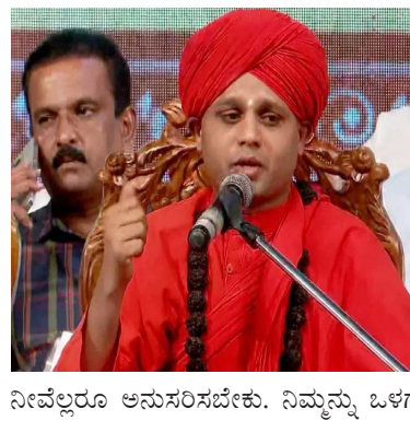
ನೀವೆಲ್ಲರೂ ಅನುಸರಿಸಬೇಕು. ನಿಮ್ಮನ್ನು ಒಳಗೆ

ಲೋಕಸಭಾ ಟಿಕ್ಟೆಟ್ ನೀಡಬೇಕು. ಸಮುದಾಯದ ಒಬ್ಬರನ್ನು ಕೆಪಿಸಿಸಿ ಮೆಂಬರ್ ಮಾಡಬೇಕು. ಈಗಾಗಲೇ ಒಬ್ಬರ ಹೆಸರನ್ನು ಸರ್ಕಾರ ರಾಜ್ಯಪಾಲರಿಗೆ ಕಳುಹಿಸಿದೆ ಎಂಬ ಮಾಹಿತಿ ಇದೆ.