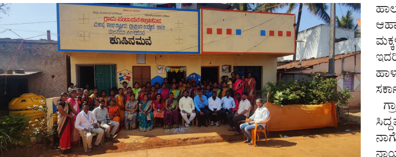
ತೆರಳುತ್ತಾರೆ. ಕೂಲಿಕಾರ್ಮಿಕರು ಹಾಗೂ ಕೃಷಿ ಕಾರ್ಮಿಕರು ಬಹುತೇಕರು ಬಡ ಕುಟುಂಬದವರಾಗಿದ್ದು, ಪ್ರತಿ-ನಿತ್ಯ ಕೂಲಿ ಕೆಲಸಕ್ಕೆ ತೆರಳುವ ಅನಿವಾರ್ಯತೆ ಇರುತ್ತದೆ. ಇಂತಹ ಕುಟುಂಬದ ಮಕ್ಕಳಿಗಾಗಿ ತಮ್ಮ