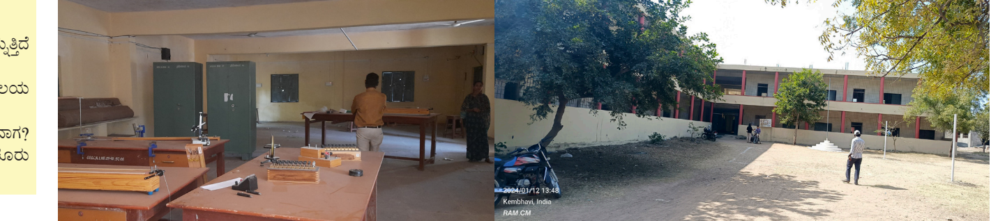
ವರದಿ: ವೀರಣ್ಣ ಕಲಕೇರಿ

ಕೆಂಭಾವಿ: ಗ್ರಾಮೀಣ ಭಾಗದ ಶೈಕ್ಷಣಿಕ ಅಭಿವೃದ್ಧಿಗಾಗಿ ಸುಮಾರು 15 ವರ್ಷಗಳ ಹಿಂದೆ ಆರಂಭವಾದ ಪಟ್ಟಣದ ಸರಕಾರಿ ಪ್ರಥಮ ದರ್ಜೆ ಕಾಲೇಜು ಸುಸಜ್ಜಿತ ಕಟ್ಟಡ ಹೊಂದಿದರೂ ಸಮಯಕ್ಕೆ ಸರಿಯಾಗಿ ತರಗತಿಗಳು ನಡೆಯುತ್ತಿಲ್ಲ ಎಂಬ ಆರೋಪ ಹಲವರಿಂದ ಕೇಳಿಬರುತ್ತಿದೆ. ನಿತ್ಯವೂ ಮದ್ಯಾಹ್ನದ ಅವಧಿಯಲ್ಲಿ ಕಾಲೇಜು ವಾತಾವರಣ ಬಿಕ್ಕೋ ಎನ್ನುವಂತಿರುತ್ತದೆ. ಕಾಲೇಜಿನಲ್ಲಿ 8 ಜನ ಕಾರ್ಯದ ಉಪನ್ಯಾಸಕರು 18 ಜನ ಸಿಬ್ಬಂದಿ ಕರ್ತವ್ಯ ನಿರ್ವಹಿಸುತ್ತಿದ್ದಾರೆ. ಆದರೂ ಸಮಯ ಪಾಲನೆ ಇಲ್ಲದ ಕಾರಣ ತರಗತಿಗಳು ಸರಿಯಾಗಿ ನಡೆಯುತ್ತಿಲ್ಲವೆಂಬ ದೂರು ವಿದ್ಯಾರ್ಥಿಗಳಿಂದಾಗಿದೆ.