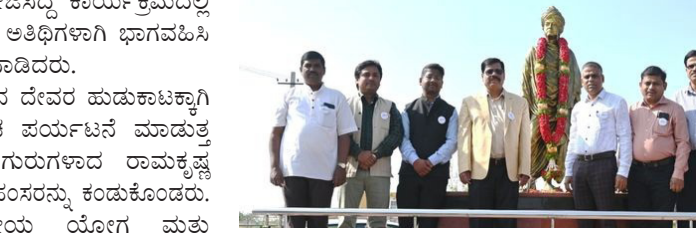
ಸಾರಿದರು. ದೇಶವನ್ನು ಅಭಿವೃದ್ಧಿಯತ್ತ ಕೊಂಡೊಯ್ಯಲು ಯುವಕರ ಸಕ್ರಿಯ ಪಾಲುಧಾರಿತ್ವ ಮುಖ್ಯ ಎಂಬುದು ವಿವೇಕಾನಂದರಿಗೆ ಸಲ್ಲುತ್ತದೆ. ತಮ್ಮ ವಿಚಾರಧಾರೆಗಳಿಂದ ವಿವೇಕಾನಂದರು ಅಲಸತೆಯಿಂದಲೇ ಪ್ರಪಂಚಕ್ಕೆ ಪರಿಚಿತರಾದವರು ಎಂದು ಹೇಳಿದರು. ಸನಾತನ ಧರ್ಮದ ತತ್ವಗಳನ್ನು ಜಗತ್ತಿಗೆ ಪರಿಚಯಿಸಿದ ಮಹಾನ್ಯ ಸ್ವಾಮಿ ವಿವೇಕಾನಂದರು. ರಾಷ್ಟ್ರ, ಜನಾಂಗ, ಧರ್ಮಕ್ಕೆ ಸೀಮಿತವಾಗದೆ ಸಾಧನೆಯ ಪ್ರತಿ ಮನುಷ್ಯನ ಗುರುತು ಎಂದು