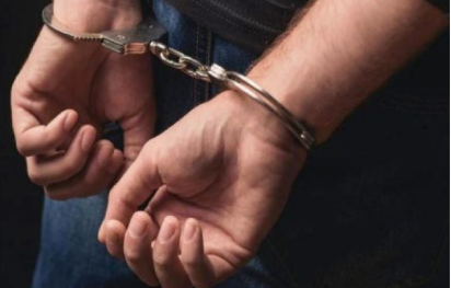
ಬಸ್ನಲ್ಲಿ ಬಾಲಕಿ ಹೋಗಿ ಬರುತ್ತಿದ್ದಳು. ದಿನನಿತ್ಯ ಖಾಸಗಿ ಬಸ್ ದಾಬಸ್ ಪೇಟೆ-ದೊಡ್ಡಬಳ್ಳಾಪುರ ಮಾರ್ಗವಾಗಿ ಬರುತ್ತಿದ್ದ ಬಸ್ನಲ್ಲಿ ಆರೋಪಿ ಕ್ಲೀನರ್ ಆಗಿ ಕೆಲಸ ಮಾಡುತ್ತಿದ್ದನು. 2021ರಲ್ಲಿ ಬ್ಯಾಡರ್‌ಹಕ್ಯ ಠಾಣೆಯಲ್ಲಿ ಇದೇ ರೀತಿ ಪೋಕ್ಸೊ ಪ್ರಕರಣದಲ್ಲಿ ಮೂರು ವರ್ಷ ಶಿಕ್ಷೆ ಅನುಭವಿಸಿ ಜೈಲಿನಿಂದ ಬಿಡುಗಡೆಯಾಗಿದ್ದನು.