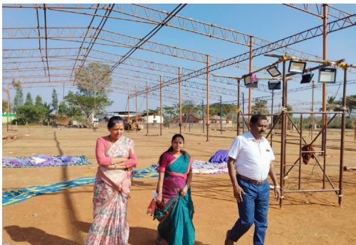
ಅಚರಿಸಲಾಗುವುದು. ಇದಕ್ಕೆ ಸಂಬಂಧಿಸಿದಂತೆ ಸಿದ್ಧತೆಗಳು ನಡೆದಿವೆ ಎಂದು ತಿಳಿಸಿದರು. ಗ್ರಾಮದ ಶಾಲೆಯ ಬಳಿ ಉತ್ಸವದ ಬೃಹತ್ ವೇದಿಕೆ ನಿರ್ಮಾಣ ಕಾರ್ಯವನ್ನು ವೀಕ್ಷಿಸಿದರು.