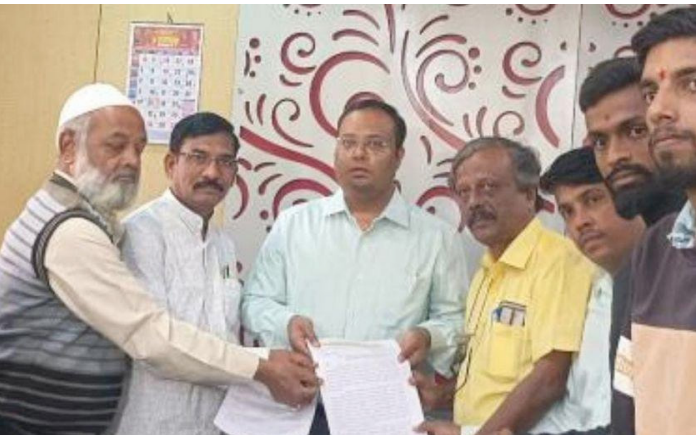
ವ್ಯವಸ್ಥೆಗೆ ವಿರುದ್ಧವಾಗಿದೆ. ಇಂತಹ ಚಟುವಟಿಕೆ ಕೈಗೊಳ್ಳುವವರ ವಿರುದ್ಧ ರಾಜ್ಯದಾದ್ಯಂತ ಕಾನೂನುನಿರೀಕ್ಷೆ ಕ್ರಮ ಕೈಗೊಳ್ಳಬೇಕು ಎಂದು ಒತ್ತಾಯಿಸಿದರು. ಭಾಷೆಯ ಆಧಾರದಲ್ಲಿ ಬೆಳಗಾವಿ ಗಡಿಭಾಗದ ಮರಾಠಿಗಳನ್ನು ಸೆಳೆಯಲು ಈ ತಂತ್ರ ಅನುಸರಿಸಲಾಗಿದೆ. ಕರ್ನಾಟಕ ಮತ್ತು ಮಹಾರಾಷ್ಟ್ರ ರಾಜ್ಯಗಳ ಗಡಿ ಕಾನೂನುನಿರೀಕ್ಷೆ ಕ್ರಮ ಕೈಗೊಳ್ಳಬೇಕು ಎಂದು ವಿವಾದ ನ್ಯಾಯಾಲಯದಲ್ಲಿರುವಾಗ ಈ ಯೋಜನೆಯ ಸಂಖ್ಯೆಗಳನ್ನು ಬಳಸಲು ಮಹಾರಾಷ್ಟ್ರ ಸರ್ಕಾರ ಹೊಂಚು ಹಾಕಿದೆ.