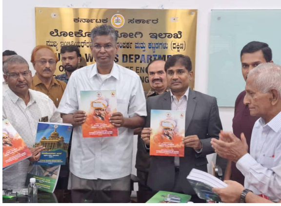
ಅನ್ವಯವಾಗುವಂತೆ 2023-24ರ ಪಾರದರ್ಶಕ ಸುಗಮ ಅಡಳಿತಕ್ಕೆ ಅವಧಿಗೆ ಅನುಷ್ಠಾನಗೊಳಿಸುವಲ್ಲಿ ಅನುಕೂಲವಾಗುವ ನಿಟ್ಟಿನಲ್ಲಿ ಸೂಚನೆ