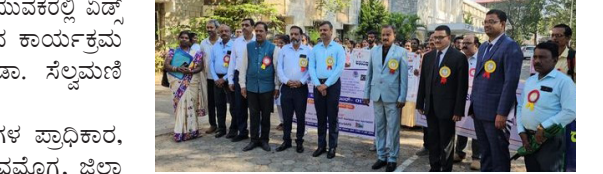
ಏಡ್ಸ್ ಕುರಿತು ಜಾಗೃತಿ ಮೂಡಿಸುವ ಕೆಲಸ ಆಗಬೇಕು: ಜಿಲ್ಲಾಧಿಕಾರಿ