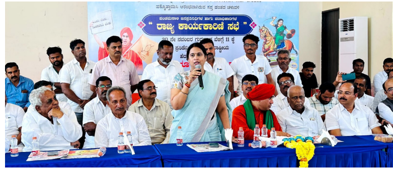
ಎಂದು ಹೆಬ್ಬಾಳಕರ್ ತಿಳಿಸಿದರು. ಬಸವಣ್ಣ ಇರಲಿ, ಅಂಬೇಡ್ಕರ್ ಇರಲಿ, ಕನಕದಾಸರಲಿ, ಐನುಕ್ಕುಸ್ಸಿ, ಪ್ರಗಂಭರ ಸೇರಿದಂತೆ ಎಲ್ಲರೂ ಸಮಾನತೆಯ ಸಂದೇಶ ಸಾರಿದ್ದಾರೆ. ನಮ್ಮಗೂ ಸಮಾನತೆ ಬೇಕು. ಹಾಗಾಗಿ ಹೋರಾಟ

ಹೋರಾಟ ದಾರಿ ತಪ್ಪದಂತೆ ನೋಡಿಕೊಳ್ಳಬೇಕು. ಯಾರೂ ಹೋರಾಟದಿಂದ ಹಿಂದೆ ಸರಿಯುವುದು ಬೇಡ, ಸಮಾಜಕ್ಕೆ ನಾನು ನ್ಯಾಯ ಕೊಡಿಸುತ್ತೇನೆ ಎಂದು ಅವರು ಭರವಸೆ ನೀಡಿದರು. ನಮ್ಮ ಮುಂದಿನ ಪೀಳಿಗೆಯ ಉಜ್ವಲ ಜೀವನಕ್ಕೆ ಮೀನಲಾತಿ ಅಗತ್ಯ. ಅದಕ್ಕಾಗಿ ಹೋರಾಟ ಅನಿವಾರ್ಯ. ಬೇರೆಯವರಿಗೆ ಮೀನಲಾತಿ ಕೊಟ್ಟಾಗ ನಾವು ಹೊಟ್ಟೆಕಿಟ್ಟು ಮಾಡ್ಬಿಲ್ಲ, ಯಾರ ತುಡ್ಡನ್ನೂ ನಾವು ಕಸಿಯುವುದಿಲ್ಲ. ಬೇರೆಯವರಿಗೆ 4 ತುಟ್ಟ ಕೊಟ್ಟು ಒಂದು ತುಟ್ಟ ತಿನ್ನುವವರು ನಾವು. ನಾನು ಹೊರಗಿದ್ದರೂ ಹೋರಾಟ ಮಾಡುತ್ತೇನೆ. ಒಳಗಿದ್ದರೂ ಹೋರಾಟ ಮಾಡುತ್ತೇನೆ. ನಾವು ಪಂಚಮಸಾಲ ಸಮಾಜದ ಶಾಸಕರಷ್ಟೇ ಸಭೆ ನಡವುವುದು ಬೇಡ. ನಮ್ಮ ಬೆಂಬಲದಿಂದ ಇನ್ನೂ ಹಲವಾರು ಶಾಸಕರು ಆಯ್ಕೆಯಾಗಿದ್ದಾರೆ. ಹೋರಾಟಕ್ಕೆ ಅವರಲ್ಲರ ಬೆಂಬಲ ಪಡೆಯೋಣ