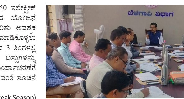
ವಾಹನಗಳ ಶುಚಿರಣ ಹಾಗೂ ಕಾರ್ಯಾಚರಣೆ ಕುರಿತು ಇನ್ನೂ ಹೆಚ್ಚಿನ ಶಿಸ್ತನ್ನು ಕೈಗೊಳ್ಳಲು ಹೇಳಿದರು. ಕೆ.ಆರ್. ಬಸ್ ಘಟಕದ ಕಾಮಗಾರಿಯನ್ನು ಮಾಡಲು ಕೈಗೊಳ್ಳಲು ಅಧಿಕಾರಿಗಳಿಗೆ ಸೂಚಿಸಿದರು.