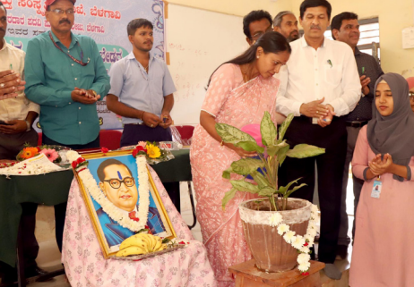
ಮಾತನಾಡಿ ಡಾ/ ಬಾಬಾಸಾಹೇಬ ಅಂಬೇಡ್ಕರವರು ಕಷ್ಟ ಜೀವನದಲ್ಲಿ ಓದಿನಲ್ಲಿ ಒಂದು ಹಿಂದೆ ಬೀಳದೆ ಶ್ರಮವಹಿಸಿ ಶಿಕ್ಷಣ ಕಲಿತು ಎಲ್ಲರಿಗೂ ದಾರಿದೀಪವಾಗಿದ್ದಾರೆ ಎಂದೂ ಬಣ್ಣಿಸಿದರು. ಅತಿಥಿಗಳಾಗಿ ಆಗಮಿಸಿದ ಎಂ ಎಂ ಮಲ್ಲಾ ಎಸ್ ಎಸ್ ಎಸ್ ಜಿಲ್ಲಾ ಕಾರ್ಯಕ್ರಮಾಧಿಕಾರಿಗಳು

ಬೆಳಗಾವಿ: ಬೆಳಗಾವಿ ಜಿಲ್ಲೆಯಲ್ಲಿ ಸ್ಥಾಪಿಸಿದ ಬದುಕು ನಡೆಸಲು ಹಾಗೂ ಒಳ್ಳೆಯ ವ್ಯಕ್ತಿತ್ವ ಹೊಂದಲು ಪ್ರಯತ್ನಿಸಲು ಶಿಕ್ಷಣ ಕಲಿಯುವುದು ಪ್ರಮುಖವಾಗಿದೆ ಆ ನಿಟ್ಟಿನಲ್ಲಿ ಇಂದಿನ ಯುವ ಜನರು ಕಾಲೇಜು ವಿದ್ಯಾರ್ಥಿ ಜೀವನವನ್ನು ವೃದ್ಧ ಮಾಡದೆ ಶ್ರದ್ಧೆಯಿಂದ ಜೀವನದ ಸಾಧನೆ ಮಾಡಬೇಕೆಂದು ಕನ್ನಡ ಮತ್ತು ಸಂಸ್ಕೃತಿ ಇಲಾಖೆಯ ಉಪನಿರ್ದೇಶಕರಾದ ವಿದ್ಯಾಪತಿ ಹೆಚ್ ಬಿ ಯುವಜನರಿಗೆ ಕರೆ ನೀಡಿದರು. ಬೆಳಗಾವಿ ಕನ್ನಡ ಮತ್ತು ಸಂಸ್ಕೃತಿ ಇಲಾಖೆ ಹಾಗೂ ಬೆಳಗಾವಿ ಸರ್ಕಾರಿ ಸದರ್‌ನ ಪೂಜಾ ಕಾಲೇಜು ಇವರ ಸಹಯೋಗದಲ್ಲಿ ಡಿ.19 2023 ರಂದು ಡಾ// ಬಿ ಆರ್ ಅಂಬೇಡ್ಕರ ಓದು ಕಾರ್ಯಕ್ರಮವನ್ನು ಆಯೋಜಿಸಲಾಗಿತ್ತು. ಸಿಸಿಗಿ ನೀರೆರದು ಉದ್ಘಾಟಿಸಿ