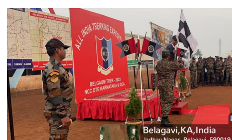
ಈ ಶಿಬಿರವು ಯುವಕರಲ್ಲಿ ಸಾಹಸ ಪ್ರವೃತ್ತಿಯನ್ನು ಮೂಡಿಸಲಿದೆ ಎಂದರು. ಯುವ ಸಮುದಾಯದಲ್ಲಿ ರಾಷ್ಟ್ರೀಯ ಹಾಗೂ ಪ್ರಜ್ಞೆಯನ್ನು ಮೂಡಿಸುವುದು ಸೌಜನ್ಯತೆಗಳನ್ನು ಸಮಯ ಚಾಲನೆಯನ್ನು ಪರಿಸರದ ಕಾಳಜಿಯ ಬಗ್ಗೆ ಜಾಗೃತಿಯನ್ನು ಹುಟ್ಟು ಹಾಕುವುದು ಶಿಬಿರದ ಉದ್ದೇಶವೆಂದರು. ವಿವಿಧ ರಾಜ್ಯಗಳಿಂದ

ಬೆಳಗಾವಿ : ಜನಾಂಗವು ರಾಷ್ಟ್ರದ ಸಂಪತ್ತಾಗಿದ್ದು ದೇಶದ ಸಂಸ್ಕೃತಿ ಪರಂಪರೆ ಹಾಗೂ ಪರಿಸರವನ್ನು ತಿಳಿದು ಕೊಳ್ಳುವುದು ಅವಶ್ಯವಾಗಿದೆ. ಪರಿಸರವನ್ನು ಸಂರಕ್ಷಿಸಿ ಅದನ್ನು ಪೋಷಿಸಿ ಬೆಳೆಸುವುದು ಕೂಡ ನಮ್ಮ ಕರ್ತವ್ಯವಾಗಿದೆ. ಎನ್‌ಸಿಸಿಯ ಪ್ರಮುಖದೈವಿಯಾಗಿದ್ದು 26 ಕರ್ನಾಟಕ ಬೆಳಗಾವಿಯನ್ ಬೆಳಗಾವಿಯ ಎನ್ ಸಿಸಿ ಕಮಾಂಡಿಂಗ್ ಆಫೀಸರ್, ಚಾರಣ ಶಿಬಿರದ ಕಮಾಂಡಿಂಗ್ ಕರ್ನಲ್‌ಎಸ್‌ದರ್‌ಶನ್ ಹೇರದರು. ಬೆಳಗಾವಿಯ ಜಾಧವ ನಗರದಲ್ಲಿ ಬೆಳಗಾವಿ ಎನ್‌ಸಿಸಿ ಗ್ರೂಪ್ ಆಡಿಯಲ್ಲಿ ಡಿಸೆಂಬರ್ 15 ರಿಂದ 22ರವರೆಗೆ ಜರುಗುತ್ತಿರುವ ಅಖಿಲ ಭಾರತ ಟ್ರ್ಯಾಕಿಂಗ್ (ಚಾರಣ) ಶಿಬಿರಕ್ಕೆ ಅವರು ಚಾಲನೆ ನೀಡಿ ಮಾತನಾಡಿದರು.