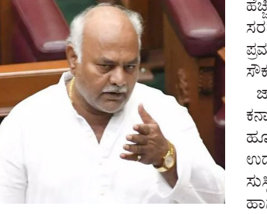
ನಂಬರ್‌ಗಳಡಿ 1000 ಎಕರೆ ಪ್ರದೇಶದಲ್ಲಿ ಸ್ಥಾಪಿಸಲು ಅನುಮೋದನೆ ನೀಡಿರುತ್ತದೆ. ರಾಜ್ಯದಲ್ಲಿ ಕೇಂದ್ರ ಸರ್ಕಾರದ ನೆರವಿನೊಂದಿಗೆ ನಿರ್ಮಿಸುವ PM-MITRA Park, ಎಲ್ಲಾ ಜವಳಿ ಮೌಲ್ಯ ಸರಬರಾಜನ್ನು ಒಂದೇ ಸ್ಥಳದಲ್ಲಿ ಸ್ಥಾಪಿಸುವ ಮೂಲಕ ಲಾಭಿಸ್ವೀಕೃತ ವೆಚ್ಚವನ್ನು ಕಡಿಮೆ ಮಾಡಿ, ಹೂಡಿಕೆಯನ್ನು ಆಕರ್ಷಿಸಿ, ಉತ್ಪಾದನೆ, ಉದ್ಯೋಗ ಮತ್ತು ರಫ್ತು ಸಾಮರ್ಥ್ಯವನ್ನು

ಸುವರ್ಣಸೌಧ: ಬೆಂಗಳೂರಿನ ರಾಜ್ಯ ಸರ್ಕಾರವು ಕಲಬುರಗಿಯಲ್ಲಿ ಪಿಎಂ ಮಿತ್ರ ಪಾರ್ಕ್ ಯೋಜನೆಯಡಿ ಸ್ಥಾಪಿಸಲು ರಚನೆಯಾಗಿರುವ ವಿಶೇಷ ಉದ್ದೇಶಿತ ವಾಹಕ (Special Purpose Vehicle) ಗೆ ಸಾಂಕೇತಿಕ ದರದಲ್ಲಿ 1000 ಎಕರೆ ಜಮೀನನ್ನು (99 ವರ್ಷಗಳ ಅವಧಿಗೆ ಪ್ರತಿ ಎಕರೆಗೆ ರೂ.1 ರಂತೆ) ಕ್ಯಾಬಿನೆಟ್ ಅನುಮೋದನೆ ಯೊಂದಿಗೆ ಹಸ್ತಾಂತರಿಸಲಾಗಿದೆ ಎಂದು ಜವಳಿ, ಕಬ್ಬು ಅಭಿವೃದ್ಧಿ ಮತ್ತು ಸಕ್ಕರೆ ಹಾಗೂ ಕೃಷಿ ಮಾರುಕಟ್ಟೆ ಸಚಿವ ಶಿವಾನಂದ ಎಸ್.ಪಾಟೀಲ ವಿಧಾನ ಪರಿಷತ್‌ನಲ್ಲಿ ತಿಳಿಸಿದರು. ಸದಸ್ಯ ಎಸ್.ತಿಪ್ಪೇಸ್ವಾಮಿ ಅವರ ಹೆಚ್ಚಿನ ಪ್ರಶ್ನೆಗೆ ಉತ್ತರಿಸಿದ ಅವರು, ರಾಜ್ಯದಲ್ಲಿ ಕೇಂದ್ರ ಸರ್ಕಾರವು ಅಂತರ ರಾಷ್ಟ್ರೀಯ ಮಟ್ಟದ ಜವಳಿ ಮತ್ತು ಸಿದ್ಧ ಉಡುಪಿನ ಪಾರ್ಕ್ ನಿರ್ಮಾಣಕ್ಕೆ PM-MITRA Park ಯೋಜನೆಯಡಿ ಕಲಬುರಗಿ ಜಿಲ್ಲೆಯ ಕಲಬುರಗಿ ತಾಲ್ಲೂಕಿನ ಕಿರೀಡಿ, ನದಿಸ್ವರೂರು ಹಾಗೂ ಫಿರೋಜಾಬಾದ್ ಗ್ರಾಮಗಳ ವಿವಿಧ ಸರ್ವೆ