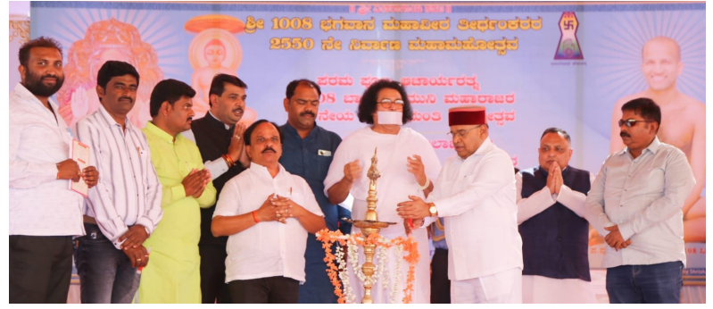
ಮಹಾಶಕ್ತಗಳನ್ನು ಅತ್ಯಂತ ಉತ್ತಮದಿಂದ ಪೂರ್ಣಗೊಳಿಸಲಾಗಿದೆ. ಶ್ರೀ ಸಿದ್ದೇಶ್ವರ ಮಹಾರಾಜ್ ಜಿ ಅವರು 2016-17 ರಲ್ಲಿ ಆಧ್ಯಾತ್ಮಿಕ ಸಂಶೋಧನಾ ಪ್ರತಿಷ್ಠಾನವನ್ನು ಸ್ಥಾಪಿಸಿದರು ಮತ್ತು ಈ ಟ್ರಸ್ಟ್ ಮೂಲಕ ಬೆಂಗಳೂರು ಮಹಾನಗರದ ಹಲವು ಗ್ರಾಮದಲ್ಲಿ ಮುನಿ ನಿವಾಸವನ್ನು ನಿರ್ಮಿಸಲಾಗಿದೆ. ಮುಂದಿನ ದಿನಗಳಲ್ಲಿ ಬೃಹತ್ ದೇವಾಲಯ, ಅನ್ಯಂತರಾಜ್ಯ, ಗುರುಕುಲ, ವೃದ್ಧಾಶ್ರಮ, ಗೋಶಾಲೆ, ಉಚಿತ ಆಸ್ಪತ್ರೆಂತಹ ಅನೇಕ ಜನಕಲ್ಯಾಣ ಕಾರ್ಯಗಳನ್ನು ಪೂರ್ಣಗೊಳಿಸುವುದು ಗೌರವಾನ್ವಿತ ಗುರುದೇವರ ಗುರಿಯಾಗಿದೆ ಎಂದು ತಿಳಿಸಿದರು. ಧರ್ಮದಿಂದ ನಡೆದು ಯುಜ್ಜವ ಪೀಳಿಗೆಯು

ಜೈನ ಧರ್ಮದ ಕೊನೆಯ ತೀರ್ಥಂಕರರಾದ ಶ್ರೀ ಮಹಾವೀರ ಸ್ವಾಮಿಗಳ "ಬದುಕು ಮತ್ತು ಬದುಕಲು ಬಿಡಿ" ಎಂಬ ಅಮರ ಸಂದೇಶಕ್ಕೆ ಜೈನ ಸಮಾಜವು ಮಾನವ ಸೇವೆಯೊಂದಿಗೆ ಅನೇಕ ಸಾಮಾಜಿಕ, ಧಾರ್ಮಿಕ, ಸಾಂಸ್ಕೃತಿಕ, ನೈತಿಕ ಮತ್ತು ದತ್ತಿ ಕಾರ್ಯಗಳ ಮೂಲಕ ಅರ್ಥವನ್ನು ನೀಡುತ್ತಿದೆ ಎಂದು ಶ್ಲಾಘಿಸಿದರು. ಇಡೀ ವಿಶ್ವದ ಗಮನ ಸೆಳೆದು ಸಾಮಾಜಿಕ, ಧಾರ್ಮಿಕ, ಆಧ್ಯಾತ್ಮಿಕ, ಶೈಕ್ಷಣಿಕ, ವೈದ್ಯಕೀಯ ಹೀಗೆ ನಾನಾ ಕ್ಷೇತ್ರಗಳಲ್ಲಿ ಪ್ರಗತಿ ಸಾಧಿಸುತ್ತಿರುವ ಜೈನ ಸಮುದಾಯದ ಪರಮಪೂಜ್ಯ ಬಾಲಾಚಾರ್ಯ ಶ್ರೀ 108 ಸಿದ್ದೇಶ್ವರ ಜಿ ಗುರುದೇವ್ ಅವರು ದೀಕ್ಷೆ ಸ್ವೀಕರಿಸಿ 25 ವರ್ಷ ಪೂರೈಸುತ್ತಿದ್ದು, ಅವರಿಗೆ ಅಭಿನಂದನೆಗಳನ್ನು ಸಲ್ಲಿಸುತ್ತಿದ್ದಾನೆ. ಈ 25 ವರ್ಷಗಳಲ್ಲಿ, ಅನೇಕ ಯಾತ್ರಾಸ್ಥಳಗಳನ್ನು ಜೀರ್ಣೋದ್ಧಾರ ಮಾಡಲಾಗಿದೆ, ನಿರ್ಮಿಸಲಾಗಿದೆ ಅನೇಕ ದೇವಾಲಯಗಳನ್ನು ನಿರ್ಮಿಸಲಾಗಿದೆ ಮತ್ತು ಅನೇಕ ಪಂಚಲೋಕ ಪ್ರತಿಷ್ಠಾ