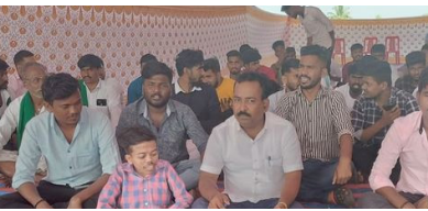
ಬೋಧಕ ಬೋಧಕತರ ಹುದ್ದೆಗಳನ್ನು ರದ್ದುಗೊಳಿಸಿ ಮರು ಅಧಿಸೂಚನೆ ಹೊರಡಿಸಬೇಕೆಂದು ಆಗ್ರಹಿಸಿ ಕರ್ನಾಟಕ ಅಧಿಕಾರಿಗಳಿಗೆ ಅನೇಕ ಬಾರಿ ಮನವಿ ಮಾಡಿಕೊಂಡಿದ್ದು, ಇದುವರೆಗೂ ಯಾವುದೇ ಕ್ರಮ ಜರುಗಿಸಿರುವುದಿಲ್ಲ ಎಂದು ಆಕ್ರೋಶ ವ್ಯಕ್ತಪಡಿಸಿದರು. "ಯುಜಿಸಿ ನಿಯಮಗಳ ಪ್ರಕಾರ ಅಧಿಸೂಚನೆಯನ್ನು ಹೊರಡಿಸಿದರೆ