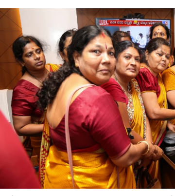
ಬೆಳಗಾವಿ: ಅಂಗನವಾಡಿ ಕಾರ್ಯಕರ್ತರ ಬೇಡಿಕೆಗಳಿಗೆ ಸಕಾರಾತ್ಮಕವಾಗಿ ಸರಕಾರ ಸ್ಪಂದಿಸಲಿದೆ ಎಂದು ಮಹಿಳಾ ಮತ್ತು ಮಕ್ಕಳ ಅಭಿವೃದ್ಧಿ ಸಚಿವೆ ನಿಶ್ಚಲ ಉಪಾಧ್ಯಕ್ಷರಿದ್ದರು.

ಲಕ್ಷ್ಮೀ ಹೆಬ್ಬಾಳಕರ್ ಭರವಸೆ ನೀಡಿದ್ದಾರೆ. ಕರ್ನಾಟಕ ರಾಜ್ಯ ಅಂಗನವಾಡಿ ಕಾರ್ಯಕರ್ತೆಯರ ಮತ್ತು ಸಹಾಯಕಿಯರ ಸ್ವತಂತ್ರ ಸಂಘಟನೆಯ ಕಾರ್ಯಕರ್ತರು ಬೆಂಗಳೂರಿನ ಪ್ರೀಡಂ ಪಾರ್ಕ್‌ನಲ್ಲಿ ಅನಿರೀಕ್ಷಕಾಲ ಧರಣಿ ಸತ್ಯಾಗ್ರಹ ನಡೆಸುತ್ತಿದ್ದು, ಬುಧವಾರ ಸಂಘಟನೆಯ ಮುಖಂಡರು ಬೆಂಗಳೂರಿನ ಲಕ್ಷ್ಮೀ ಹೆಬ್ಬಾಳಕರ್ ಅವರ ಗೃಹಕಚೇರಿಗೆ ಆಗಮಿಸಿ ಮನವಿ ಸಲ್ಲಿಸಿದರು.