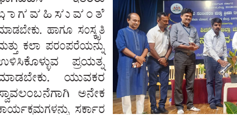
ಭಾಗವಹಿಸಿ ಇತರರು ಭಾಗವಹಿಸುವಂತೆ ಮಾಡಬೇಕು. ಹಾಗೂ ಸಂಸ್ಕೃತಿ ಮತ್ತು ಕಲಾ ಪರಂಪರೆಯನ್ನು ಉಳಿಸಿಕೊಳ್ಳುವ ಪ್ರಯತ್ನ ಮಾಡಬೇಕು. ಯುವಕರ ಸ್ವಾವಲಂಬನಗಾಗಿ ಅನೇಕ ಕಾರ್ಯಕ್ರಮಗಳನ್ನು ಸರ್ಕಾರ ರೂಪಿಸಿದ್ದು ಅದನ್ನು ಬಳಕೆ ಮಾಡಿಕೊಳ್ಳಲಿ ಎಂದು ಕರೆ ನೀಡಿದರು.