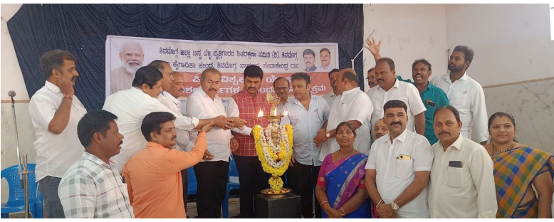
ಪೊರಕೆ ತಯಾರಕರು, ಗೊಂಬೆ ಮತ್ತು ಆಟಿಕೆ ತಯಾರಕರು (ಸಾಂಪ್ರದಾಯಿಕ), ಕೌಶಿಕ್ ವೃತ್ತಿ ತಯಾರಕರು, ಸುತ್ತಿಗೆ ಮತ್ತು ಉಪಕರಣಗಳನ್ನು ತಯಾರಿಸುವವರು, ಹೂಮಾಲೆ ತಯಾರಕರು, ಅಗಸರು (ದೋಬಿ), ಆಭರಣ ತಯಾರಕರು, ಶಿಂಟಿಗ (ಬಟ್ಟೆ ಹೊಲೆಯುವವರು), ಕುಂಬಾರ ವೃತ್ತಿ

ಶಿವಮೊಗ್ಗ ಜಿಲ್ಲಾ ಚಿನ್ನ-ಬೆಳ್ಳಿ ವೃತ್ತಿಗಾರರ ಹಿತಾಸಕ್ತಿಯನ್ನು ಹೆಚ್ಚಿಸಲು, ಜಿಲ್ಲಾ ಕೈಗಾರಿಕಾ ಕೇಂದ್ರ ಶಿವಮೊಗ್ಗ ಹಾಗೂ ಸಾಮಾನ್ಯ ಸೇವಾ ಕೇಂದ್ರ ರವರ ಸಹಕಾರದೊಂದಿಗೆ ಇಂದು ಗಾಂಧಿ ಬಜಾರಿನ ಬಸವೇಶ್ವರ ದೇವಸ್ಥಾನ ಸಭಾಂಗಣದಲ್ಲಿ ಏರ್ಪಡಿಸಲಾಗಿದ್ದ "ಪಿ.ಎಂ.ವಿಶ್ವಕರ್ಮ" ಯೋಜನೆಯಡಿ ಕುಶಲಕರ್ಮಿಗಳ ನೋಂದಣಿ ಕಾರ್ಯಕ್ರಮ ಉದ್ಘಾಟಿಸಿ ಮಾತನಾಡಿದರು.