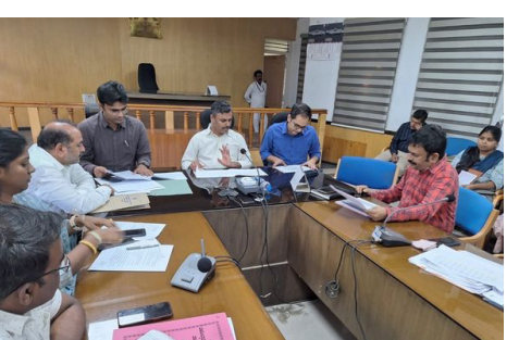
ಗ್ರಾ.ಪಂ ವಾರು ರೈತರ ಜಮೀನುಗಳನ್ನು ಗುರುತಿಸಿ ಫಲಿಟ್ (FRUITS) ತಂತ್ರಾಂಶದಲ್ಲಿ ಬರ ನಿರ್ವಹಣೆ ಸಂಬಂಧ ನವೆಂಬರ್ ಮಾಸಾತ್ಯದೊಳಗಾಗಿ ತಾಲ್ಲೂಕು ಟಾಸ್ಪೋರ್ಸ್ ಸಭೆ ನಡೆಸುವಂತೆ ತಹಶೀಲ್ದಾರರಿಗೆ ಸೂಚಿಸಿದ ಅವರು ಜಾನುವಾರುಗಳ ಮೇವಿನ ಸಮಸ್ಯೆ ಪರಿಹರಿಸಲು ಸೂಕ್ತ ಕ್ರಮ ಕೈಗೊಳ್ಳುವಂತೆ ತಿಳಿಸಿದರು.