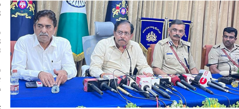
ಹಾಜರಾಗಿದ್ದರೆ ವಾಹನ ಸೀಜ್ ಮಾಡಬೇಕು ಎಂದು ಗೃಹ ಸಚಿವ ಪರಮೇಶ್ವರ್ ನಿರ್ದೇಶನ ನೀಡಿದರು. ಸಂಚಾರ ನಿಯಮ ಉಲ್ಲಂಘನೆ ದಂಡ ವಿಧಿಸುವ ವಿಧಾನ, ಚಲನೆ ಜನರೇಷ್ ಮಾಡುವ ವಿಧಾನವನ್ನು ಪರಿಶೀಲಿಸಿದರು.

ಸೂಕ್ತ ತಾಂತ್ರಿಕ ತರಬೇತಿ ಹೊಂದಿದ ಅಧಿಕಾರಿ ಹಾಗೂ ಸಿಬ್ಬಂದಿಯನ್ನು ನಿಯೋಜಿಸಲು ಸೂಚನೆ ನೀಡಿದರು. ಇದಾದ ಬಳಿಕ ನಗರ ನಿಯಂತ್ರಣ ಕೋಡ್‌ಗಳನ್ನು ಹಾಗೂ ವೆಬ್‌ ಲೈವ್ ವಿಭಾಗದ ಕಾರ್ಯಚಟುವಟಿಕೆಗಳನ್ನು ಹಾಗೂ ದಾಖಲೆ ಕೋಡ್‌ಗಳನ್ನು ಮುಖಾಂತಿ ವಿವರಿಸಿದರು. ನಿಯಂತ್ರಣ ಕೋಡ್‌ಗೆ ಬರುವ ಕೆರೆಗಳು ಹಾಗೂ ಮಾಹಿತಿಯು ಲಾಗ್ ಪ್ರಕ್ರಿಯೆಯ ಪರಿಶೀಲನೆಗಾಗಿ ಪ್ರತಿಯೊಂದು ದಾಖಲೆಯನ್ನು ಸಮರ್ಪಕವಾಗಿ ನಿರ್ವಹಿಸಬೇಕು ಎಂದು ತಿಳಿಸಿದರು.