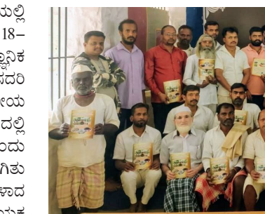
ಸಮಯದ ಸದುಪಯೋಗ ಪಡೆದು ಇಂತಹ ತರಬೇತಿಗಳಲ್ಲಿ ಭಾಗವಹಿಸಿ ತಮ್ಮ ಜ್ಞಾನವನ್ನು ಹೆಚ್ಚಿಸಿಕೊಳ್ಳಬೇಕು ಎಂದು ಹೇಳಿದರು. ಕಾರ್ಯಕ್ರಮ ಉದ್ಘಾಟಿಸಿ ಡಾ|| ಅಶೋಕ ದುರಗನ್ನರ ಮಾತನಾಡಿ ಪುಸ್ತಕಗಳನ್ನು ವಿವಿಧ ಅಭಿವೃದ್ಧಿ ತರಬೇತಿಗಳನ್ನು ನೀಡಲಾಗಿದ್ದು ಈಗ ಕೋಶ ಸಾಕಾಣಿಕೆ ತರಬೇತಿಯು ಪೂರ್ಣಗೊಂಡಿದ್ದು ಈ ತರಬೇತಿಯಲ್ಲಿ ಪಡೆದ ಜ್ಞಾನದ ಸದುಪಯೋಗವಾಗಬೇಕು

ಬೆಳಗಾವಿ: ಕೇಂದ್ರ ಕಾರಾಗೃಹ ಬೆಳಗಾವಿಯಲ್ಲಿ ಕೈದಿಗಳಿಗಾಗಿ ದಿನಾಂಕ:16-11-2023 ರಿಂದ 18-11-2023 ರವರೆಗೆ ಮೂರು ದಿನಗಳ ವೈಜ್ಞಾನಿಕ ಕೋಶ ಸಾಕಾಣಿಕೆ ತರಬೇತಿ ಆಯೋಜಿಸಲಾಗಿತ್ತು ಸದರಿ ತರಬೇತಿಯು ಪುಸ್ತಕಗಳನ್ನು ಮತ್ತು ಪುಸ್ತಕವ್ಯಕ್ತಿಯ ಸೇವಾ ಇಲಾಖೆ ಬೆಳಗಾವಿ ಇವರ ಸಹಯೋಗದಲ್ಲಿ ಆಯೋಜಿಸಲಾಗಿತ್ತು. ದಿನಾಂಕ-18-11-2023 ರಂದು ತರಬೇತಿಯು ಸಮಾರಂಭ ಸಮಾರಂಭ ಜರುಗಿತು ಮತ್ತು ಅತಿಥಿಗಳಾಗಿ ಮುಖ್ಯ ಪುಸ್ತಕವ್ಯಕ್ತಿಯಾದ ಡಾ|| ಅಶೋಕ ದುರಗನ್ನರ ಹಾಗೂ ಸಹಾಯಕ ನಿರ್ದೇಶಕರಾದ ಡಾ|| ಈಶ್ವರ ಕೋಲಾರರ ಆಗಮಿಸಿದ್ದರು. ಅಧ್ಯಕ್ಷತೆಯನ್ನು ಕಾರಾಗೃಹದ ಮುಖ್ಯ ಅಧೀಕ್ಷಕರಾದ ಶ್ರೀ ಕೃಷ್ಣಕುಮಾರ್ ವಹಿಸಿದ್ದರು. ಕೈದಿಗಳಿಗೆ ಪ್ರಮಾಣ ಪತ್ರ ವಿತರಿಸಿ, ಡಾ|| ಈಶ್ವರ ಕೋಲಾರರ ಮಾತನಾಡಿ, ತರಬೇತಿಗಳು ನಿವಾಸಿಗಳಿಗೆ ಅತ್ಯವಶ್ಯಕ ಹೆಜ್ಜೆಯನ್ನು ಹಾಕಿ ಒತ್ತಡದಿಂದ ಹೊರಬರಲು ಸಹಾಯ ಮಾಡುತ್ತವೆ. ತಾವು ಯಾರೂ ಹುಟ್ಟಿನಿಂದ ಅಪರಾಧಿಗಳಾಗಿರುವುದಿಲ್ಲ. ಜೀವನದಲ್ಲಿ ನಡೆದ ಅಕ್ಕಾಕ್ಕಿ ಘಟನೆಯಿಂದಾಗಿ ಕಾರಾಗೃಹಕ್ಕೆ ಬಂದಿರುತ್ತೀರಿ. ಇಲ್ಲಿನ