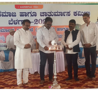
ಮುನಿಗಳ ಸೇವೆ ಮಾಡುವುದು ಸಹ ಧರ್ಮ ರಕ್ಷಣೆಯ ಒಂದು ಭಾಗವಾಗಿದೆ. ಮುನಿಗಳು ಎಲ್ಲವನ್ನೂ ತ್ಯಾಗ ಮಾಡಿ ಧರ್ಮ ಪ್ರಚಾರದಲ್ಲಿ ನಿರತರಾಗಿತ್ತಾರೆ. ಅವರ ಧರ್ಮಕಾರ್ಯಕ್ಕೆ ಎಲ್ಲರೂ ಸಹಕರಿಸಬೇಕೆಂದು ಅವರು ಹೇಳಿದರು. ಇಂದು ಜೈನ ಧರ್ಮ ವಿವಿಧ ಒಳಪಂಗಡದಲ್ಲಿ

ಬೆಳಗಾವಿ: ಇಂದಿನ ಯುಗದಲ್ಲಿ ಧರ್ಮವನ್ನು ಕಾಪಾಡಿ ಧರ್ಮವನ್ನು ಬೆಳೆಸುವ ಜೊತೆಗೆ ಧರ್ಮವನ್ನು ರಕ್ಷಣೆ ಮಾಡುವುದು ಪ್ರತಿಯೊಬ್ಬರ ಕರ್ತವ್ಯವಾಗಿದೆ ಎಂದು ಜೈನ ಮುನಿ ಶ್ರೀ. 108 ಪ್ರಸಂಗನಗರ ಮುನಿಗಳು ಹೇಳಿದರು. ರವಿವಾರದಂದು ಬೆಳಗಾವಿ ಮಿಲೇನಿಯಂ ಗಾರ್ಡನ್ ಸಭಾಂಗಣದಲ್ಲಿ ಚಾರ್ತಮಾಸ ವಿಸರ್ಜನೆ ಮತ್ತು ಪಿಂಚಿ ಪರಿವರ್ತನೆ ಕಾರ್ಯಕ್ರಮದ ಸಾನ್ನಿಧ್ಯ ವಹಿಸಿ ಅತಿಥಿಗಳನ್ನು ನೀಡಿದ ಮುನಿಗಳು ಇಂದು ಜೈನ ಧರ್ಮ ನೆಲೆ ಹೋಗುವ ಹಂತದಲ್ಲಿದೆ. ಧರ್ಮವನ್ನು ಕಾಪಾಡುವುದು ಮತ್ತು ಅದರ ರಕ್ಷಣೆ ಮಾಡುವುದು ಪ್ರತಿಯೊಬ್ಬರ ಧರ್ಮಿಯ ಕರ್ತವ್ಯವಾಗಿದೆ ಎಂದು ಅವರು ಹೇಳಿದರು.