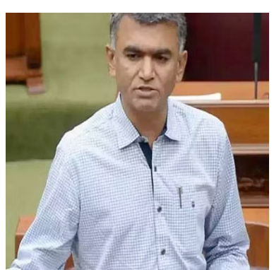
ಪ್ರತಿಯೊಂದು ಗ್ರಾಮಾಂತರ ಗಡಿ ಹಾಗೂ ಸರ್ವೆ ನಂಬರ ಗಡಿಯಲ್ಲೂ ವ್ಯತ್ಯಾಸಗಳಿವೆ. ಆದರೆ, ಈ ಬಗ್ಗೆ ಸರ್ಕಾರ ದಾಖಲೆಗಳಲ್ಲಿ ನಿಖರ ವಿವರಣೆ ಇಲ್ಲ. ಪರಿಣಾಮ ರೈತರು ತಮ್ಮದಲ್ಲದ ತಪ್ಪಿಗೆ ಸಾಕಷ್ಟು ನೋವನ್ನು ಅನುಭವಿಸಿದ್ದಾರೆ. "ಸರ್ವೆ ನಂಬರ ಡಿಪ್ಲೊಮ್ಯಾಟ್" ಎಂಬುದು ರೈತರ ಪಾಲಿಗೆ ಸಾಮಾನ್ಯ ಸಮಸ್ಯೆ ಎಂಬಂತಾಗಿದೆ. ಸರ್ಕಾರಿ ಜಮೀನನ್ನು

ಗುರುತಿ ಸಿ ರಕ್ಷಿಸುವುದೂ ದೊಡ್ಡ ಸವಾಲಾಗಿದೆ. ಹೀಗಾಗಿ ಈ ಎಲ್ಲಾ ಸಮಸ್ಯೆಗೆ ಇತ್ತೀಚೆಗೆ ಹಾಡುವ ಸಲುವಾಗಿ ಇಂದು ಕನಕಪುರ ತಾಲೂಕು ಉಯ್ಯಂಬಳ್ಳಿ ಹೋಬಳಿಯಲ್ಲಿ ಡೋಣ್ ಜಾಲಿತ ಭೂ ಮರು ಮಾಪನಕ್ಕೆ (01 ಸರ್ವೆ) ಚಾಲನೆ ನೀಡಲಾಯಿತು ಎಂದು ಹೇಳಿದರು. ಹೊಸ ತಂತ್ರಜ್ಞಾನದಲ್ಲಿ ಡೋಣ್ ಪ್ರತಿ ಚೆ.ಕೆ.ಲೋಟರ್ ಗೆ 4000 ಕ್ಕೂ ಅಧಿಕ ಫೋಟೋ ತೆಗೆಯುತ್ತದೆ. ಈ ಫೋಟೋಗಳ ಆಧಾರದಲ್ಲಿ ವೈಜ್ಞಾನಿಕವಾಗಿ ಹಿಡುವಳಿ ಭೂಮಿ, ಗೋಮಾಳ, ಹುಲ್ ಬನ್ನಿ, ಸರ್ಕಾರಿ ಖರಾಬು, ಇನಾಮು ಮತ್ತು ಕೆರೆ ಭೂಮಿಗಳನ್ನು ಗುರುತಿಸಲಾಗುವುದು. ಈ ಮೂಲಕ ರೈತರ ಸರ್ವೆ ಡಿಪ್ಲೊಮ್ಯಾಟ್ ಗಳಿಗೆ ತಾತ್ಕಾಲಿಕ ಪರಿಹಾರ ಹಾಗೂ ಸರ್ಕಾರಿ ಭೂಮಿ ಗುರುತಿ ಸಿ ಒತ್ತುವರೆ ತೆರವು ಮಾಡಲು ಸರ್ಕಾರಿಯಾಗುವುದು. ಈ ಪ್ರಾಯೋಗಿಕ ರೀ ಸರ್ವೆ ಯಶಸ್ವಿಯಾದರೆ ರಾಜ್ಯಾದ್ಯಂತ ಎಲ್ಲಾ ಕೃಷಿ ಜಮೀನುಗಳನ್ನೂ ಡೋಣ್ ಮೂಲಕ ರೀ ಸರ್ವೆ ಮಾಡುವ ಚಿಂತನೆ ಇದೆ ಎಂದು ತಿಳಿಸಿದರು.