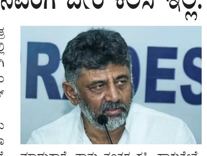
ಮಾಡುತ್ತಾರೆ. ನಾನು ನಂತರ ಸಹಿ ಹಾಕುತ್ತೇನೆ. ನಾನು ಬಗ್ಗು ಹುಕು ಸಮಿತಿ ಅಧ್ಯಕ್ಷ ಆಗಿದ್ದೇನೆ. ಎಲ್ಲಾ ನೋಡೋದಕ್ಕೆ ಆಗಲ್ಲ ಎಂದು. ಯತೀಂದ್ರ ಸಿದ್ದರಾಮಯ್ಯ ಅವರು ಸಿಎಂಗೆ ದಾರಿ ತಪ್ಪಿಸುತ್ತಿದ್ದಾರೆ ಅನ್ನೋ ಬಿಜೆಪಿ ನಾಯಕರ ಹೇಳಿಕೆಗೆ ಪ್ರತಿಕ್ರಿಯಿಸಿದ ಡಿ ಕೆ ಶಿವಕುಮಾರ್, ಮುಖ್ಯಮಂತ್ರಿ ಅವರಿಗೆ 40 ವರ್ಷಗಳ ರಾಜಕೀಯ ಅನುಭವ ಇದೆ. ಯಾರು ದಾರಿ ತಪ್ಪಿಸಲು ಆಗಲ್ಲ ಎಂದು. ಬಿಜೆಪಿ ಮತ್ತು ಜೆಡಿಎಸ್‌ನವರಿಗೆ ಪಾಪ ಏನೂ ಕೆಲಸ ಇಲ್ಲ. ಯತೀಂದ್ರ ಅವರು ಕೆಡಿಪಿ ಸದಸ್ಯರಿದ್ದಾರೆ. ಆಶ್ಚರ್ಯ ಸಮಿತಿ ಅಧ್ಯಕ್ಷರಾಗಿದ್ದಾರೆ. ಜನ ಸಂಪರ್ಕ ಸಭೆ ನಡೆಸುತ್ತಿದ್ದಾರೆ. ಈ ಸಂದರ್ಭದಲ್ಲಿ ಕೆಲವು ಶಾಲೆಗಳಿಗೆ ಮೂಲಸೌಲಭ್ಯ ಕಲ್ಪಿಸುವ ವಿಚಾರವಾಗಿ

ಬೆಂಗಳೂರು: ಸಿಎಂ ಸಿದ್ದರಾಮಯ್ಯನವರ ಪುತ್ರ ಡಾ ಯತೀಂದ್ರ ಸಿದ್ದರಾಮಯ್ಯ ಮೊಬೈಲ್ ನಲ್ಲಿ ಮಾತನಾಡಿದ ಲಿಪಿ ವಿಡಿಯೋ ವ್ಯಾಪಕವಾಗಿ ವೈರಲ್ ಆಗಿ ವಿವಾದವಾಗುತ್ತಿದ್ದಂತೆ ಡಿ.ಕೆ. ಶಿವಕುಮಾರ್ ಯತೀಂದ್ರ ಪರ ಬ್ಯಾಟ್ ಬೀಸಿದ್ದಾರೆ. ಕುಮಾರಸ್ವಾಮಿ ಅವರು ಯತೀಂದ್ರ ಕುರಿತು ಹಂಚಿಕೊಂಡಿರುವ ವಿಡಿಯೋದಲ್ಲಿ ಎಲ್ಲಾ ದರೂ ವರ್ಗಾವಣೆ ಅಂತ ಪದ ಇದೆಯೇ? ಲಂಚದ ಬಗ್ಗೆ ಎಲ್ಲಿ ಮಾತನಾಡಿದ್ದಾರೆ? ಸುಮ್ಮನೆ ಪ್ರಚಾರ ಮಾಡಿ ನಮ್ಮ ಹುಡುಗನನ್ನು ಲೀಡ್ ಮಾಡುತ್ತಿದ್ದಾರೆ. ಮಾಡಲಿ ಬಿಡಿ ಎಂದು ಉಪಮುಖ್ಯಮಂತ್ರಿ ಡಿ ಕೆ ಶಿವಕುಮಾರ್ ಹೇಳಿದರು.