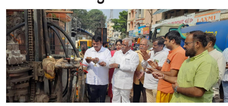
ಬಹಳ ಕುಸಿತವಾಗಿದ್ದು ಅಂತರ್ಜಲ ಮಟ್ಟ ನಿರೀಕ್ಷಿಸುವುದು, ಗಿಡಮರ ಬೆಳೆಸುವುದು, ಆರಣ್ಯ ದಿನ ದಿನಕ್ಕೆ ಕಡಿಮೆಯಾಗುತ್ತಿದೆ. ಮುಂದಿನ ದಿನಗಳಲ್ಲಿ ಅಂತರ್ಜಲ ಮಟ್ಟವನ್ನು ಹೆಚ್ಚಿಸುವ ದೃಷ್ಟಿಯಿಂದ ನಾವೆಲ್ಲರೂ ಇಂಥ ಗುಂಡಿ

ಬೆಳಗಾವಿ: ನೀರು ಭಗವಂತ ಕೊಟ್ಟ ಪ್ರಸಾದ ಅದನ್ನು ಸರಿಯಾಗಿ ಬಳಕೆ ಮಾಡುವ ಮುಖಾಂತರ ನೀರನ್ನು ಉಳಿಸುವ ಮತ್ತು ಹಿತಮಿತವಾಗಿ ಬಳಸುವ ಜವಾಬ್ದಾರಿ ನಮ್ಮೆಲ್ಲರ ಮೇಲಿದೆ ಎಂದು ರಾಜ್ಯಸಭಾ ಸಂಸದ ಈರಣ್ಣ ಕಡಾಡಿ ಹೇಳಿದರು. ಗುರುವಾರ ನ-16 ರಂದು ರಾಜ್ಯಸಭಾ ಸಂಸದರ ಸ್ಥಳೀಯ ಪ್ರದೇಶಾಭಿವೃದ್ಧಿ ಯೋಜನೆಯಡಿ ಬೆಳಗಾವಿ ನಗರದ ವಾರ್ಡ್ ನಂ-4 ನಗರನಂದಕ ಭಾವ ಚೌಕ ದತ್ತಾತ್ರೇಯ ಮಂದಿರ ಹತ್ತಿರ ಬೊರವೆಲ್ (ಕೊಳವೆ ಬಾವಿ) ಕೊರೆಯುವ ಕಾರ್ಯಕ್ಕೆ ಪೂಜೆ ಸಲ್ಲಿಸಿ, ಚಾಲನೆ ನೀಡಿ ಮಾತನಾಡಿದರು. ಇತ್ತೀಚೆಗೆ ದೇಶದಲ್ಲಿ ಮಳೆಯ ಪ್ರಮಾಣ