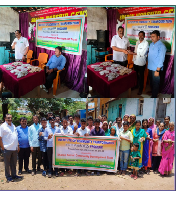
ಆಹಾರ ಪ್ರತಿ ದಿವಸ ಸ್ನಾನ ಹಲ್ಲು ಉಜ್ಜುವುದನ್ನು ತಲೆಗೆ ಎಣ್ಣೆ ಸ್ನಾನ ಪ್ರತಿ ದಿವಸ ಇರಿ ಎಂದು ಕಿವಿ ಮಾತನ್ನು ಹೇಳಿದರು ಶುದ್ಧ ನೀರು ಒಳ್ಳೆಯ ಕುದಿಸಿ ಬೇಯಿಸಿದ