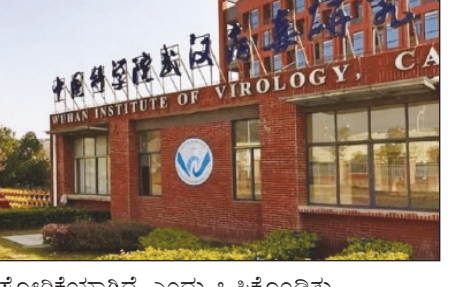
ಸೋಲಿಕೆಯಾಗಿದೆ ಎಂದು ಒಪ್ಪಿಕೊಂಡಿತ್ತು ಯುಎಸ್ ಮಧ್ಯಮದ ತನಿಖೆಗಳು ಫುಹಾನ್ ಲ್ಯಾಬ್ ಗೆ ಯುಎಸ್ ಸರ್ಕಾರದಿಂದ ಜೆನೆಟಿಕ್ ಎಂಜಿನಿಯರಿಂಗ್ ಪ್ರಯೋಗಗಳಿಗೆ ಹಣವನ್ನು ನೀಡಲಾಗಿತ್ತು ಎಂದು ಬಹಿರಂಗವಾಗಿತ್ತು.

ವಾಷಿಂಗ್ಟನ್: ರಿಪಬ್ಲಿಕ್ ಪಕ್ಷದ ಪ್ರಾಬಲ್ಯ ಹೊಂದಿರುವ ಯುಎಸ್ ಕಾಂಗ್ರೆಸ್, ಕೋವಿಡ್ 19 ರ ಮೂಲದ ಬಗ್ಗೆ ಮಾಹಿತಿಯನ್ನು ಬಹಿರಂಗಪಡಿಸಲು ರಾಷ್ಟ್ರೀಯ ಗುಪ್ತಚರ ನಿರ್ದೇಶಕರಿಗೆ ಅನುಮತಿ ನೀಡುವ ಮಸೂದೆಯನ್ನು ಅಂಗೀಕರಿಸಿದೆ.