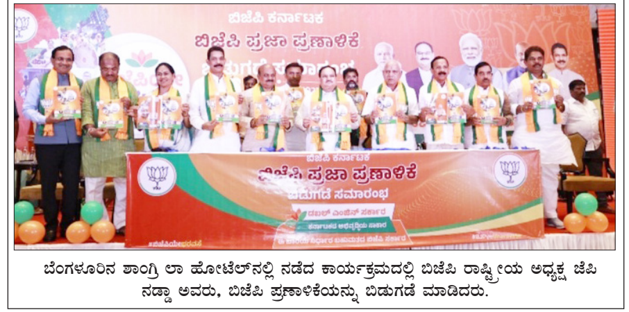
ಬೆಂಗಳೂರಿನ ಶಾಂಗೈ ಲಾ ಹೋಟೆಲ್‌ನಲ್ಲಿ ನಡೆದ ಕಾರ್ಯಕ್ರಮದಲ್ಲಿ ಬಿಜೆಪಿ ರಾಷ್ಟ್ರೀಯ ಅಧ್ಯಕ್ಷ ಚಿಪಿ ನಡ್ಡಾ ಅವರು, ಬಿಜೆಪಿ ಪ್ರಣಾಳಿಕೆಯನ್ನು ಬಿಡುಗಡೆ ಮಾಡಿದರು.

ರಿಗೆ ಅನುಕೂಲಕರ ಕಾರ್ಯಕ್ರಮವನ್ನು ರೂಪಿಸಲಾಗಿದೆ. ಸಿಲಿಂಡರ್ ಬೆಲೆ ಬಗ್ಗೆಯೂ ಪ್ರಣಾಳಿಕೆಯಲ್ಲಿಯೇ ಎಂದು ತಿಳಿಸಿದರು. ಬಳಕೆ ಕಾಂಗ್ರೆಸ್ ವಿರುದ್ಧ ವಾಗ್ವಾಳಿ ನಡೆಸಿದ ಅವರು, ಬೇರೆ ಪಕ್ಷದ ರೀತಿ ಸುಳ್ಳು ಭರವಸೆ ಕೊಡಬೇಡಿ ಎಂದು ತಿರಸ್ಕಾರ ಮಾಡಿದ್ದಾರೆ. ಜನರಿಗೆ ಅವರ ಮೇಲೆ ವಿಶ್ವಾಸ ಇಲ್ಲ. ಕಾಂಗ್ರೆಸ್ ಅಡಳಿತ ರಾಜ್ಯದಲ್ಲಿ ಭರವಸೆ ಈಡೇರಿಸಲಾಗಿಲ್ಲ, ಹಾಗಾಗಿ ಅವರನ್ನು ಹೇಳಿದರು.