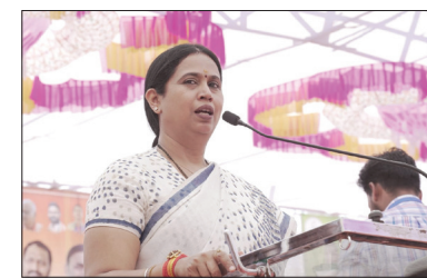
ಕಾಂಗ್ರೆಸ್ ಪಕ್ಷದ ನಾಲ್ಕು ಗ್ಯಾರಂಟಿಗಳನ್ನು ಖಾತರಿಂದ ಕಾಯುತ್ತಿದ್ದಾರೆ. ಕಾಂಗ್ರೆಸ್ ಅಧಿಕಾರಕ್ಕೆ ಬಂದರೆ ಮೊದಲ ಸಚಿವಸಂಪುಟ ಸಭೆಯಲ್ಲೇ ನಾಲ್ಕು ಗ್ಯಾರಂಟಿಗಳಾದ 200

ನಡೆದ ಪ್ರಜಾಧ್ವನಿ ಕಾರ್ಯಕ್ರಮದಲ್ಲಿ ಪಾಲ್ಗೊಂಡು ಅವರು ಮಾತನಾಡಿದರು. ಇಡೀ ರಾಜ್ಯದಲ್ಲಿ ಕಾಂಗ್ರೆಸ್ ಪರವಾದ ಅಲೆ ಇದೆ. ಅದಕ್ಕೆ ಇಲ್ಲಿ ಇಷ್ಟು ದೊಡ್ಡ ಸಂಖ್ಯೆಯಲ್ಲಿ ಸೇರಿರುವ ಜನರೇ ಸಾಕ್ಷಿ. ನನ್ನ ಮತ ಕ್ಷೇತ್ರವಾಗಿರುವ ಬೆಳಗಾವಿ ಗ್ರಾಮೀಣದಲ್ಲಿ ಜನರು ನಾನು ಪ್ರಚಾರಕ್ಕೆ ಹೋದಲ್ಲೆಲ್ಲ ಬರಮಾಡಿಕೊಳ್ಳುವ ರೀತಿ ನೋಡಿದರೆ ಕಾಂಗ್ರೆಸ್ ಖಂಡಿತ ಅತ್ಯಧಿಕ ಬಹುಮತದಿಂದ ಈ ಬಾರಿ ಸರ್ಕಾರ ರಚಿಸಲಿದೆ ಎನ್ನುವುದು ಗೊತ್ತಾಗುತ್ತದೆ. ಬೆಲೆ ಏರಿಕೆಯಿಂದಾಗಿ ಜೀವನ ನಡೆಸಲಾಗದೆ ತತ್ತರಿಸಿ ಹೋಗಿರುವ ಜನರು