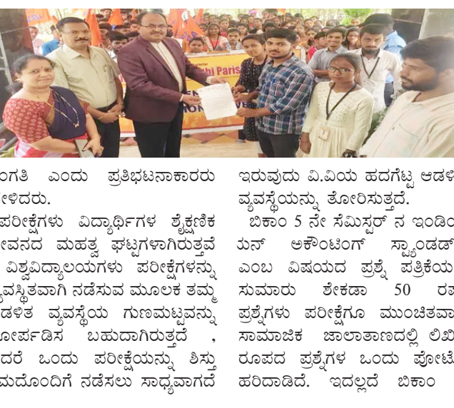
ಸಂಗತಿ ಎಂದು ಪ್ರತಿಭಟನಾಕಾರರು ಹೇಳಿದರು. ಪರೀಕ್ಷೆಗಳು ವಿದ್ಯಾರ್ಥಿಗಳ ಶೈಕ್ಷಣಿಕ ಜೀವನದ ಮಹತ್ವ ಘಟ್ಟಗಳಾಗಿರುತ್ತವೆ. ವಿಶ್ವವಿದ್ಯಾಲಯಗಳು ಪರೀಕ್ಷೆಗಳನ್ನು ವ್ಯವಸ್ಥಿತವಾಗಿ ನಡೆಸುವ ಮೂಲಕ ತಮ್ಮ ಆಡಳಿತ ವ್ಯವಸ್ಥೆಯ ಗುಣಮಟ್ಟವನ್ನು ತೋರಿಸಬೇಕು ಬಹುದಾಗಿರುತ್ತದೆ. ಆದರೆ ಒಂದು ಪರೀಕ್ಷೆಯನ್ನು ಶಿಸ್ತು ಕ್ರಮದೊಂದಿಗೆ ನಡೆಸಲು ಸಾಧ್ಯವಾಗದೆ

ಬೆಳಗಾವಿ: ರಾಣಿ ಚನ್ನಮ್ಮ ವಿ.ವಿ.ಯು ಪ್ರಶ್ನೆ ಪತ್ರಿಕೆಗಳು ಸೋರಿಕೆಯಾಗಿರುವುದು ಖಂಡನಾರ್ಹ. ಈ ಕೂಡಲೇ ಪ್ರಕರಣ ದಾಖಲಿಸಿ ತಪ್ಪಿತಸ್ಥರ ವಿರುದ್ಧ ಕಾನೂನು ಕ್ರಮ ಕೈಗೊಳ್ಳಬೇಕು ಎಂದು ಆಗ್ರಹಿಸಿ ಅಖಿಲ ಭಾರತ ವಿದ್ಯಾರ್ಥಿ ಪರಿಷತ್ ಕಾರ್ಯಕರ್ತರು ಪ್ರತಿಭಟನೆ ನಡೆಸಿದರು. ರಾಣಿ ಚನ್ನಮ್ಮ ವಿಶ್ವವಿದ್ಯಾಲಯ ರಾಜ್ಯದಲ್ಲಿ ಉತ್ತಮ ಹೆಸರನ್ನು ಹೊಂದಿದ್ದು ಗುಣಮಟ್ಟದ ಶಿಕ್ಷಣ, ಉತ್ತಮ ಆಡಳಿತಾತ್ಮಕ ವ್ಯವಸ್ಥೆಗೆ ಹೆಸರುವಾಸಿಯಾಗಿರುವ ವಿಶ್ವವಿದ್ಯಾಲಯವಾಗಿದೆ. ಆದರೆ ಇತ್ತೀಚಿನ ದಿನಗಳ ಘಟನೆಗಳು ವಿ.ವಿ. ಪ್ರತಿಷ್ಠೆಗೆ ಕಷ್ಟ ಚುಕ್ಕೆ ತರುವಂತಾಗಿರುವುದು ವಿಷಾದನೀಯ