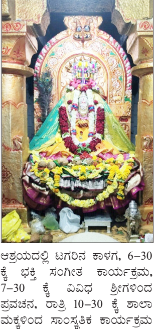
ಅಶ್ರಯದಲ್ಲಿ ಟಗರಿನ ಕಾಳಗ, 6-30 ಕ್ಕೆ ಭಕ್ತಿ ಸಂಗೀತ ಕಾರ್ಯಕ್ರಮ, 7-30 ಕ್ಕೆ ವಿವಿಧ ಶ್ರೀಗಳಿಂದ ಪ್ರವಚನ, ರಾತ್ರಿ 10-30 ಕ್ಕೆ ಶಾಲಾ ಮಕ್ಕಳಿಂದ ಸಾಂಸ್ಕೃತಿಕ ಕಾರ್ಯಕ್ರಮ ನಡೆಯಲಿವೆ. ದಿ. 16 ರಂದು ಬೆಳಿಗ್ಗೆ ಮಹಾಭಿಷೇಕ, ದೇವಿಯ ಹೊನ್ನಾಟ, ಸಾಯಂಕಾಲ 7-30 ಕ್ಕೆ ಶ್ರೀಗಳಿಂದ ಪ್ರವಚನ, ರಾತ್ರಿ 10-30 ಕ್ಕೆ ಶ್ರೀ ಮಹರ್ಷಿ ವಾಲ್ಮೀಕಿಯವ ನಾಟ್ಯ ಸಂಘ ಹೊನ್ನಗಾ-ಹೆಗ್ಗೇರಿ ಅವರಿಂದ ಬೆಟ್ಟಕ್ಕೆ ಬೆಂಕಿ ಹಚ್ಚಿದ ಮಲಿ ಸಾಮಾಜಿಕ ನಾಟಕ ಪ್ರದರ್ಶನವಾಗಲಿದೆ. ದಿ. 17 ರಂದು ಬೆಳಿಗ್ಗೆ ಮಹಾಭಿಷೇಕ, 9-00 ಘಂಟೆಗೆ ಉಡಚಮ್ಮಾದೇವಿ ಗೆಳೆಯರ ಬಳಗದಿಂದ ಮುಕ್ತ ರಂಗೋಲಿ ಸ್ಪರ್ಧೆ, ಸಾಯಂಕಾಲ 4-00 ಘಂಟೆಗೆ ಬಯಲುಗಣದ ಕುಸ್ತಿಗಳು, ಸಾಯಂಕಾಲ 6-00 ಘಂಟೆಗೆ ದೇವಿಗೆ ಸಪ್ತ ದೀಪೋತ್ಸವ, 7-00 ಘಂಟೆಗೆ ಭಕ್ತಿ ಸಂಗೀತ ಕಾರ್ಯಕ್ರಮ, ಶ್ರೀಗಳಿಂದ ಪ್ರವಚನ, ರಾತ್ರಿ 10-30 ಕ್ಕೆ ಕೊತಬಾಳದ ವೈವಿಧ್ಯಮಯ ಜಾನಪದ ಕಲಾ ತಂಡ ಆವರಿದ

ಬೈಲಹೊಂಗಲ: ತಾಲೂಕಿನ ಸುಕ್ಷೇತ್ರ ದೇವಲಾಪೂರ ಗ್ರಾಮದ ಶ್ರೀ ಉಡಚಮ್ಮಾದೇವಿ 16 ನೇ ವರ್ಷದ ಜಾತ್ರಾ ಮಹೋತ್ಸವ ಹಾಗೂ ಅಮ್ಮನ ಉತ್ಸವ-2023 ಏ. 18 ರವರೆಗೆ ಇಂಚಿನಲ್ಲಿ ಶ್ರೀ ಶಿವಯೋಗೇಶ್ವರ ಸಾಧು ಸಂಸ್ಥಾನ ಮಠದ ಪೂಜ್ಯ ಡಾ. ಶಿವಾನಂದ ಭಾರತಿ ಶ್ರೀಗಳ ಸಾನಿಧ್ಯ, ಬೈಲಹೊಂಗಲದ ಶಿವಾನಂದ ಮಠದ ಪೂಜ್ಯ ಮಹಾದೇವ ಸರಸ್ವತಿ ಸ್ವಾಮೀಜಿ ಅಧ್ಯಕ್ಷತೆ ಹಾಗೂ ನೇಸರಗಿ-ಮಲ್ಲಾಪೂರದ ಶ್ರೀ ಗಾಳೇಶ್ವರ ಮಠದ ಪೂಜ್ಯ ಚಿವಾನಂದ ಸ್ವಾಮೀಜಿ ನೇತೃತ್ವದಲ್ಲಿ ಸಡಗರ ಸಂಭ್ರಮದಿಂದ ಜರುಗಲಿದೆ. ದಿ. 15 ರಂದು ಬೆಳಿಗ್ಗೆ ಉಡಚಮ್ಮಾದೇವಿಗಿ ಮಹಾಭಿಷೇಕ, 8-00 ಘಂಟೆಗೆ ದೇವಿಯ ಪಲ್ಲಕ್ಕಿ ಉತ್ಸವ, ಹೊನ್ನಾಟ, ಸಂಜೆ 5-00 ಘಂಟೆಗೆ ಗಜಾ ವಾಯ್ ಕಮಿಟಿ