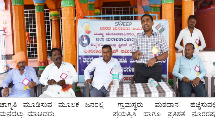
ಜಾಗೃತಿ ಮೂಡಿಸುವ ಮೂಲಕ ಜನರಲ್ಲಿ ಗ್ರಾಮಸ್ಥರು ಮತದಾನ ಹೆಚ್ಚಿಸುವಲ್ಲಿ ಪ್ರಯತ್ನಿಸಿ ಹಾಗೂ ಪ್ರತಿಶತ ನೂರರಷ್ಟು ಮತದಾನ ಮಾಡುವಂತೆ ಗ್ರಾಮಸ್ಥರಿಗೆ