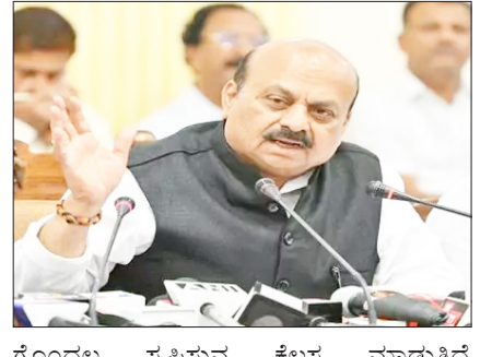
ಗೊಂದಲ ಸೃಷ್ಟಿಸುವ ಕೆಲಸ ಮಾಡುತ್ತಿದೆ. ಕರ್ನಾಟಕದ ಗಡಿಯಲ್ಲಿರುವ ಕೆಲವರಿಗೆ ವಿಮೆ ನೀಡುವ ಆದೇಶ ಮಾಡಿರುವುದು ಉದ್ದೇಶಪೂರ್ವಕವೆಂದು ಆರೋಪಿಸಿದ್ದಾರೆ.

ಬೆಂಗಳೂರು: ಕರ್ನಾಟಕದ ಗಡಿ ಭಾಗದ ಜನರಿಗೆ ಆರೋಗ್ಯ ವಿಮೆ ಯೋಜನೆ ಜಾರಿಗೊಳಿಸುವ ಆದೇಶ ಹೊರಡಿಸಿರುವ ಮಹಾರಾಷ್ಟ್ರ ಸರ್ಕಾರಕ್ಕೆ ಮುಖ್ಯಮಂತ್ರಿ ಬಸವರಾಜ ಬೊಮ್ಮಾಯಿ ಖಡಕ್ ವಾನಿಠಿಂಗ್ ಮಾಡಿದ್ದಾರೆ. ಆದೇಶವನ್ನು ತಕ್ಷಣ ಹಿಂಜರಿ ಪಡೆಯಿರಿ. ಇಲ್ಲವಾದಲ್ಲಿ ಮಹಾರಾಷ್ಟ್ರದಲ್ಲಿರುವ ಕನ್ನಡಿಗರಿಗಾಗಿ ನಾವೂ ಅಂತಹದೇ ಯೋಜನೆ ಜಾರಿಗೊಳಿಸುತ್ತೇವೆ ಎಂದು ಅವರು ಎಚ್ಚರಿಸಿದ್ದಾರೆ. ಈ ಕುರಿತು ಬೊಮ್ಮಾಯಿ ಟ್ವೀಟ್ ಮಾಡಿದ್ದಾರೆ. ಕರ್ನಾಟಕ ಮಹಾರಾಷ್ಟ್ರ ಗಡಿ ವಿವಾದ ಸುತ್ತೀಂ ಕೋರ್ಟ್ ನಲ್ಲಿ ಇದ್ದರೂ ಮಹಾರಾಷ್ಟ್ರ ಸರ್ಕಾರ ಎರಡೂ ರಾಜ್ಯಗಳ ಗಡಿ ಭಾಗದಲ್ಲಿ