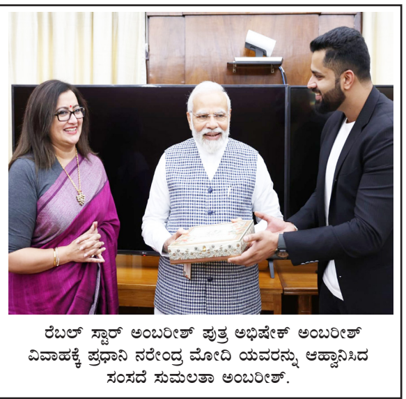
ರಬಲ್ ಸ್ಟಾರ್ ಅಂಬರೀಶ್ ಪುತ್ರ ಅಭಿಷೇಕ್ ಅಂಬರೀಶ್ ವಿವಾಹಕ್ಕೆ ಪ್ರಧಾನಿ ನರೇಂದ್ರ ಮೋದಿ ಯವರನ್ನು ಆಹ್ವಾನಿಸಿದ ಸಂಸದ ಸುಮತಾ ಅಂಬರೀಶ್.