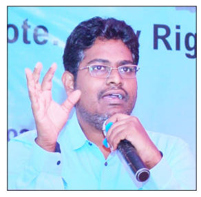
ತಿಳಿಸಿದ್ದಾರೆ. ಸೋಮವಾರ ಸಂಜೆ ರೂಪನಗುಡಿ ಚೆಕ್‌ಪೋಸ್ಟ್ ಬಳಿ ತಪಾಸಣೆ ನಡೆಸುವ ವೇಳೆ ಅಂಧ ಪ್ರದೇಶ ಪರವಾನಿಗೆ ಹೊಂದಿದ ವಾಹನದಲ್ಲಿ 4.8 ಕೆಜಿ ಬೆಳ್ಳಿ ಅಂದಾಜು ಮೌಲ್ಯ 1.21 ಲಕ್ಷ, 405 ಗ್ರಾಂ ಚಿನ್ನ ಅಂದಾಜು ಮೌಲ್ಯ 23.92 ಲಕ್ಷ ರೂ. ಹಾಗೂ 24.5 ಸಾವಿರ ರೂ. ನಗದು ವಶಪಡಿಸಿಕೊಳ್ಳಲಾಗಿದೆ. ಈ ಕುರಿತು ಆರೋಪಿತನ

ಮೇಲೆ ಬ್ಲಾಕ್‌ವೇಜ್ ಠಾಣೆಯಲ್ಲಿ ಪ್ರಕರಣ ದಾಖಲಿಸಲು ನ್ಯಾಯಾಲಯಕ್ಕೆ ಮನವಿ ಸಲ್ಲಿಸಲಾಗಿದೆ ಎಂದು ಜಿಲ್ಲಾ ಚುನಾವಣಾಧಿಕಾರಿ ಪವನ್ ಕುಮಾರ್ ಮಾಲಪಾಟಿ ತಿಳಿಸಿದ್ದಾರೆ. *51 ಪ್ರಕರಣ, 16.59 ಲಕ್ಷ ರೂ. ನಗದು ವಶಕ್ಕೆ:ಅಬಕಾರಿ ಇಲಾಖೆಯಿಂದ 45 ಪ್ರಕರಣ ಹಾಗೂ ಫೈಯಿಂಗ್ ಸ್ಟಾಡ್(-ಎಫ್‌ಎಸ್)3, ಸ್ಟಾಟಿಸ್ಟಿಕ್ ಸರ್ವೆಸ್‌ವೆಲ್‌ನ್ಸ್ ಟೀಮ್(-ಎಸ್‌ಎಸ್‌ಟಿ) 2 ಹಾಗೂ ಪೊಲೀಸ್ ಇಲಾಖೆ 1 ಸೇರಿದಂತೆ ಒಟ್ಟು 51ಪ್ರಕರಣಗಳನ್ನು ದಾಖಲಿಸಿಕೊಳ್ಳಲಾಗಿದೆ. *ನೀತಿ ಸಂಹಿತೆ ಕಟ್ಟುನಿಟ್ಟಿನ ಜಾರಿಗೆ ತಂದಾಗ ಕಾರ್ಯ ಪ್ರವೃತ್ತಿ:ಜಿಲ್ಲೆಯಾದ್ಯಂತ ನೀತಿ ಸಂಹಿತೆ ಕಟ್ಟುನಿಟ್ಟಾಗಿ ಜಾ-