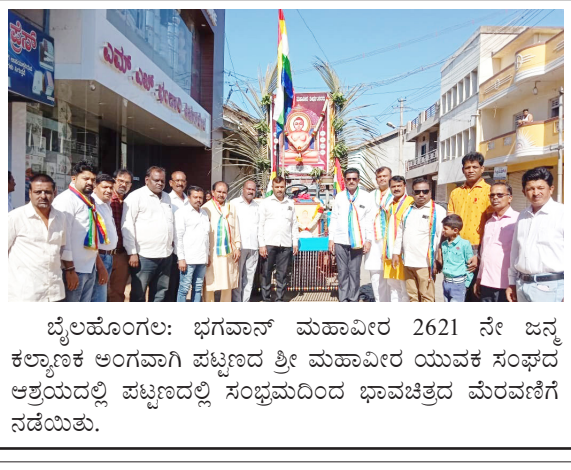
ಬೈಲಹೊಂಗಲ: ಭಗವಾನ್ ಮಹಾವೀರ 2621 ನೇ ಜನ್ಮ ಕಲ್ಯಾಣಕ ಅಂಗವಾಗಿ ಪಟ್ಟಣದ ಶ್ರೀ ಮಹಾವೀರ ಯುವಕ ಸಂಘದ ಆಶ್ರಯದಲ್ಲಿ ಪಟ್ಟಣದಲ್ಲಿ ಸಂಭ್ರಮದಿಂದ ಭಾವಚಿತ್ರದ ಮೆರವಣಿಗೆ ನಡೆಯಿತು.