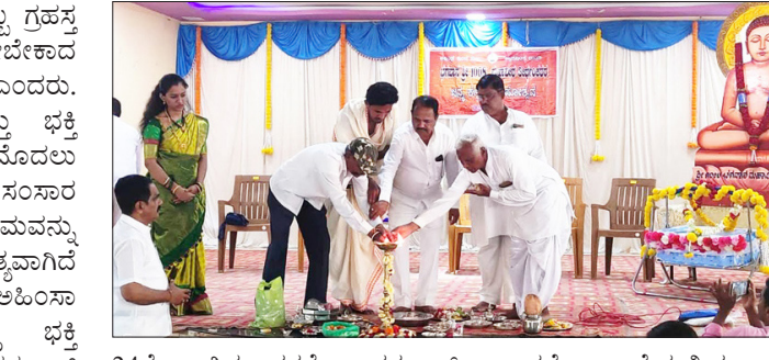
24ನೇ ತಿರ್ಥಂಕರರ ಭಗವಾನ್ ಮಹಾವೀರರು ಆಗಿದ್ದಾರೆಂದರು. ಕೇವಲ ಜೈನ ಧರ್ಮಿಯರೆಂಬುದು ಹೇಳುವುದು ಬೇಡಾ ಆಚರಣೆಯಿಂದ ಜೈನರಾಗಿ ಎಂದು ಅವರು ಹೇಳಿದ್ದಾರೆ ಪಂಚತತ್ವ ಪರಿಪಾಲಕರು ಜೈನ ಧರ್ಮದ ವರಗಾಗಿದ್ದಾರೆಂದೂ ಪಂಚತತ್ವ ಪಾಲನೆ ಮಾಡಬೇಕಾಗುವವರ ಕುರಿತು ವಿವರಿಸಿದರು. 6ನೇ ಶತಮಾನದ ಈ ಏಷಿಯಾ ಖಂಡ ಹೇಗಿತ್ತು ಎಂಬುದರ ಕುರಿತು ತಿಳಿ ಹೇಳಿದ ಅವರು ಜನರಲ್ಲಿ ಸ್ವಾರ್ಥ

ಶಾಳಿಕೋಟಿ: ಮಹಾವೀರ ತೀರ್ಥಂಕರರು ಜೈನ ಧರ್ಮಕ್ಕೆ ಯಾವಾಗಲೂ ಸತ್ಯ ಮತ್ತು ಅಹಿಂಸೆಯ ಮತ್ತು ಬದ್ಧರು. ಮತ್ತು ಬದ್ಧತೆ ಮತ್ತು ಬಿಡು ಎಂಬ ಸಂದೇಶವನ್ನು ಸಾರಿದ್ದಾರೆ ಕಾರಣ ಮುಂದಿನ ಫಿಳಿಗೆ ಅವರ ಆದರ್ಶಗಳನ್ನು ಪಾಲಿಸಬೇಕಾಗಿದೆ ಎಂದು ಬಾಬಾನಗರದ ಪ್ರತಿಷ್ಠಾಪಕಾರ್ಯದಾಯ ವ್ಯವಸ್ಥಾಪಕರು ಅವರು ನುಡಿದರು. ಮಂಗಳವಾರದಂದು ಸ್ಥಳೀಯ ಜೈನ ಸಮಾಜದ ವತಿಯಿಂದ ಜೈನ ಸಮಾಜದ ಕೈಲ್ಯಾಣ ಮಂಟಪದಲ್ಲಿ ಏರ್ಪಡಿಸಲಾದ 1008 ಭಗವಾನ್ ಶ್ರೀ ಮಹಾವೀರ ತಿರ್ಥಂಕರರ 2622ನೇಯ ಜನ್ಮ ಕಲ್ಯಾಣ ಮಹೋತ್ಸವ ಕುರಿತು ಏರ್ಪಡಿಸಲಾದ ದಾರ್ಮಿಕ ಸಭೆಯಲ್ಲಿ ದಿವ್ಯ ಸಾನಿಡ್ಲಿ ವಹಿಸಿ ಮಾತನಾಡುತ್ತಿದ್ದ ಅವರು ಮಾನವ ಶ್ರೇಷ್ಠನಾಗಬೇಕಾದರೆ ಪುಟ್ಟಿಂದ ಅಲ್ಲಾ ರ್ಧರ್ಮಗಳನ್ನು ಮುಟ್ಟಿ ಹೇಳಿದ್ದಾರೆಂದರು. ದೇವ ಪೂಜೆ ಗುರು ಉಪಾಸನೆ ಸ್ವಾದ್ಯಾಯ ಮನುಷ್ಯ ಸಯಂಮ ತಪ ಹಾಗೂ