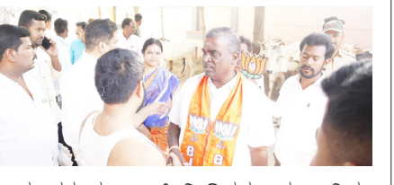
ಕಾರ್ಯಕ್ರಮ ಸಾಥ್ ನೀಡಿದ್ದರು. ಸದಾ ನಿಮ್ಮ ಕರೆಗೆ ಓಗೊಡುವಂತ ವ್ಯಕ್ತಿಗೆ ಮತ ನೀಡಿ ಎಂದು ತಾವು ಮತ್ತೊಮ್ಮೆ ಸ್ಪರ್ಧೆ ಮಾಡಲು ಬಯಸಿದ್ದು ಮತ ನೀಡಬೇಕೆಂದು ಕೋರಿದರು.