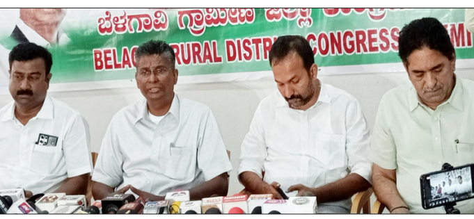
ಅವರು ಹೇಳಿದರು. ಯಾವ ಕ್ಷೇತ್ರದಲ್ಲಿ ಯಾವ ಅಭ್ಯರ್ಥಿ ಬಂಡಾಯದ ಕ್ಷೇತ್ರದಲ್ಲಿ ಕಾಂಗ್ರೆಸ್ ಸೂಕ್ತ ಎಂದು ಕಾಂಗ್ರೆಸ್ ಹೈಕಮಾಂಡ್ ಪ್ರಯತ್ನಗಳು ನಡೆದಿವೆ. ಟಿಕೆಟ್ ವ್ಯಕ್ತಿಗೆ ಟಿಕೆಟ್ ಸಿಗಬೇಕೆಂಬುದು ನಿರೀಕ್ಷಿಸಲಾಗುವುದು.