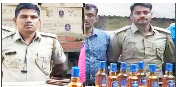
ಅಮಾನತು ಮಾಡಿ ಅಬಕಾರಿ ಡಿಸಿ ಆದೇಶ ಹೊರಡಿಸಿದ್ದಾರೆ. ಚುನಾವಣೆ ನಿಮ್ಮ ಅಕ್ರಮವಾಗಿ ಸಾಗಿಸುತ್ತಿದ್ದ ಸಾರಾಯಿಯನ್ನು ಅಬಕಾರಿ ಅಧಿಕಾರಿಗಳು ಮಾ. 7ರಂದು ಜಿಲ್ಲೆಯ ಖಾನಾಪುರ ತಾಲೂಕಿನ ಮೋಡೆಲೊಪ್ಪ ಗ್ರಾಮದ ಬಳಿ ಜಪ್ತಿ ಮಾಡಲಾಗಿತ್ತು. 12 ಚಕ್ರದ ಕಂಟೇನರ್ ವಾಹನದಲ್ಲಿ ಗೋವಾದಿಂದ ಸಾಗಿಸುತ್ತಿದ್ದಾಗ 753 ಬಾಕ್ಸು ಅಕ್ರಮ ಮಧ್ಯ ಸಿಕ್ಕಿತ್ತು. ಈ ವೇಳೆ 301 ಬಾಕ್ಸುಗಳನ್ನು ಬಚ್ಚಿಟ್ಟು, ಕೇವಲ 452 ಬಾಕ್ಸು ಜಪ್ತಿ ಮಾಡಿದ್ದೇವೆ ಎಂದು ಅಬಕಾರಿ ಸಿಬ್ಬಂದಿಗಳು ಸುಳ್ಳು ಕೇಸ್ ದಾಖಲಿಸಿದ್ದಾರೆ.

ಬೆಳಗಾವಿ: ಜಪ್ತಿ ಮಾಡಿದ್ದು 753 ಸಾರಾಯಿ ಬಾಕ್ಸುಗಳ ಪೈಕಿ 301 ಬಾಕ್ಸುಗಳನ್ನೇ ಅಧಿಕಾರಿಗಳು ಮತ್ತು ಸಿಬ್ಬಂದಿಗಳು ಕದ್ದಿದ್ದು, ಜಿಲ್ಲೆಯ ಅಬಕಾರಿ ಅಧಿಕಾರಿಗಳ ಕಾರ್ಯಯೋಜನೆ ಮೇಲಾಧಿಕಾರಿಗಳೇ ಶಾಕ್ ಆಗಿದ್ದಾರೆ. ಇದು ಒಂದು ರೀತಿಯಲ್ಲಿ ಬೇಲಿಯೇ ಎದ್ದು ಹೋಲ ಮೈಯ್ಯಂತಿದೆ. ಕೆಲ ಅಧಿಕಾರಿಗಳು ಮತ್ತು ಸಿಬ್ಬಂದಿಗಳಿಂದಾಗಿ ಇಡೀ ಅಬಕಾರಿ ಇಲಾಖೆಯೇ ತಲೆ ತಗ್ಗಿಸುವಂತಾಗಿದೆ. 301 ಬಾಕ್ಸುಗಳಿದ್ದು 32 ಲಕ್ಷ ರೂ. ಮೌಲ್ಯದ ಇಂಪೊರ್ಟ್ ಬ್ರಾಂಡ್, ವಿಸ್ಕಿ ಮಧ್ಯದ ಬಾಟಲ್ ಕಳಚಿನ ಮಾಡಿದ್ದು, ಜಪ್ತಿಯಾದ ಮಾರನೇ ದಿನ ಬದು ಜನ ಸಿಬ್ಬಂದಿ ಮಾಡಿದ ಕರಾಮತ್ತು ಬೆಳಕಿಗೆ ಬಂದಿದೆ.