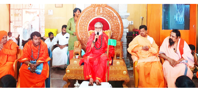
ಆಚಾರ್ಯರು ಉಳಿಸಿ ಬೆಳೆಸಿಕೊಂಡು ಬಂದಿದೆ. ಬದುಕು ಬದಲಾಗಬೇಕಾದರೆ ಬಂದಿರಬೇಕು ಮತ್ತು ಸುಧಾರಣೆ-ಯ ಹೆಸರಿನಲ್ಲಿ ಸಂಸ್ಕಾರ ಸಂಸ್ಕೃತಿ ಶಿವಾಚಾರ್ಯರು ಕೆಲಸ ನಡೆಯುತ್ತಿದೆ. ಇಂಥ ಸಂದರ್ಭದಲ್ಲಿ ಈ ನಾಡಿನ ಧರ್ಮ ಪೀಠಗಳು ಮತ್ತು ಮಠಾಧೀಶರ ಮೇಲೆ ಉತ್ಕೃಷ್ಟ ಸಂಸ್ಕೃತಿ ಉಳಿಸಿ ಬೆಳೆಸುವ ಜವಾಬ್ದಾರಿಯಿದೆ. ವೀರಶೈವ ಧರ್ಮ ಅತ್ಯಂತ ಪ್ರಾಚೀನವಾಗಿದ್ದು ಸಕಲ ಜೀವಾತ್ಮರಿಗೂ ಒಳಿತನ್ನೇ ಬಯಸುತ್ತಾ