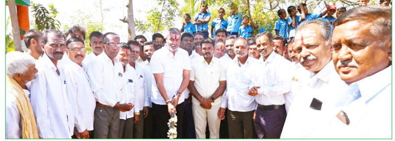
ಸರ್ಕಾರಿ ಪ್ರೌಢ ಶಾಲೆ ಸುಣಧೋಳಿ, ಹೊಸಯರಗುದ್ದಿ, ಧವಳೇಶ್ವರ, ತುಕ್ಕಾನಟ್ಟಿ ತೋಟ, ಮದಲಮಟ್ಟಿ(ಶಿವಾಪುರ-ಹ), ವಿಜಯನಗರ ಮೂಡಲಗಿ, ನಾಗಲಿಂಗ ನಗರ, ಸರ್ಕಾರಿ ಪ್ರೌಢ ಶಾಲೆ ತಳಕಟ್ಟಾಳ, ಶಾಲಾ ಕೊಠಡಿಗಳಿಗೆ ತಲಾ 13.90 ಲಕ್ಷ ರೂ. ಗಳಂತೆ ಒಟ್ಟು 4.37 ಕೋಟಿ ರೂ. ಗಳು ಬಿಡುಗಡೆಯಾಗಿದ್ದು, ಕಾಮಗಾರಿಗಳಿಗೆ ಚಾಲನೆ

ಶ್ರಮಿಸುತ್ತಿರುವುದಾಗಿ ಅವರು ಹೇಳಿದರು. ಸರ್ಕಾರಿ ಹಿರಿಯ ಪ್ರಾಥಮಿಕ ಶಾಲೆ ಬೆಟಗೇರಿ, ಬೆಳವಿ ತೋಟ(ಬಳೋಬಾಳ), ಒಳಕಲಮರಡಿ(ದಂಡಾಪುರ), ಭಗೀರಥ ನಗರ(ಗುಜನಟ್ಟಿ), ಹೊಸಯರಗುದ್ದಿ, ಅಂಬಿಗರ ತೋಟ ನಂ.2(ಹುಣಶ್ಯಾಳ ಪಿಪಿ), ಮುನ್ಯಾಳ ತೋಟ, ಅರಣ್ಯಸಿದ್ಧೇಶ್ವರ ತೋಟ, ನಾಗನೂರ, ಫಾಮಲದಿನ್ನಿ ತೋಟ, ಜೋಕಾನಟ್ಟಿ 2 ಶಾಲೆಗಳ ಪ್ರೌಢ ಶಾಲಾ ಕೊಠಡಿಗಳು, ಕಪರಟ್ಟಿ ತಳಕಟ್ಟಾಳ 3 ಶಾಲೆಗಳ ಕೊಠಡಿಗಳು, ಮಬನೂರ ತೋಟ ಶಿವಾಪುರ-2, ಹೆಣ್ಣು ಮಕ್ಕಳ ಶಾಲೆ ಬೆಟಗೇರಿ-2, ನಿಂಗಾಪುರ, ಲಕ್ಷ್ಮೀಶ್ವರ, ದುರದುಂಡಿ, ಬಿ.ಪ್ಲಿ. ನರಗುಂದ