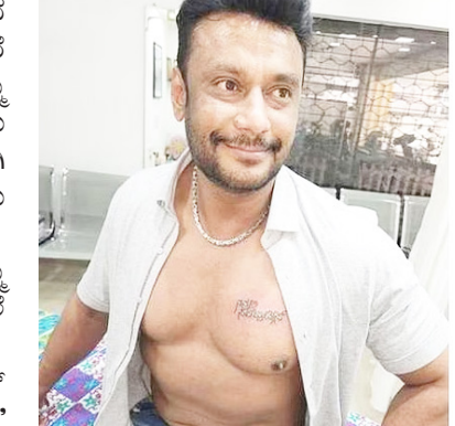
ಕೊಟ್ಟಿದ್ದಾರೆ. ಬಹುಶಃ ಚಿತ್ರೋದ್ಯಮದ ಇತಿಹಾಸದಲ್ಲಿ ಅಭಿಮಾನಿಗಳ ಪ್ರೀತಿಯನ್ನು ಹಚ್ಚಿಯ ಮೂಲಕ ಎದೆಗೆ ಇಳಿಸಿಕೊಂಡ ನಟ ದರ್ಶನ್

ಬೆಂಗಳೂರು: ಸಿನಿಮಾ ನಟನಿಗಾಗಿ ಆತನ ಅಭಿಮಾನಿಗಳು ತಮ್ಮ ಕೈ ಮೇಲೆ, ಎದೆ ಮೇಲೆ ಟ್ಯಾಟು ಹಾಕಿಕೊಂಡು ತಮ್ಮ ಅಭಿಮಾನವನ್ನು ತೋರಿಸಿಕೊಳ್ಳುವುದು ಕಾಮನ್. ಆದರೆ ತನ್ನ ಅಭಿಮಾನಿಗಳಿಗಾಗಿ ನಟನೇವರ್ ಟ್ಯಾಟು ಹಾಕಿಕೊಳ್ಳುವುದು ಅತಿ ಅಪರೂಪ.